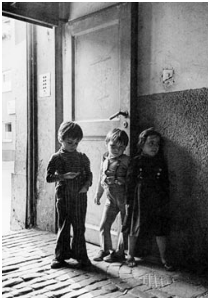
Armut in der BRD

So geraten nun neben der Kreation von Gruppen auch ganze Quartiere ins Visier einer sich als „nachhaltig“ qualifizierenden Strategie. „Sektorenübergreifend“ soll die Verwaltungsmodernisierung vorangetrieben und, merkantil aufgepeppt, als Stadtteilmanagement und Bewohneraktivierung »problem- und projektbezogen« in den sog. benachteilig-