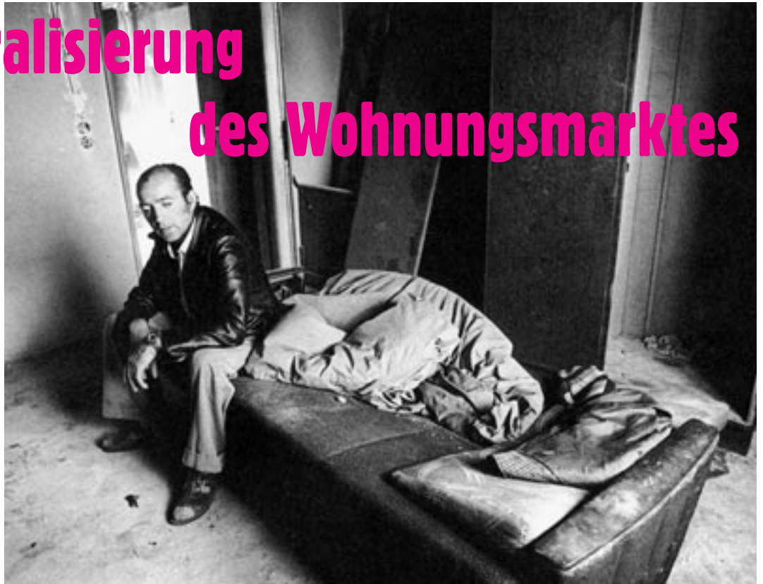
Wohnungsnot in der BRD