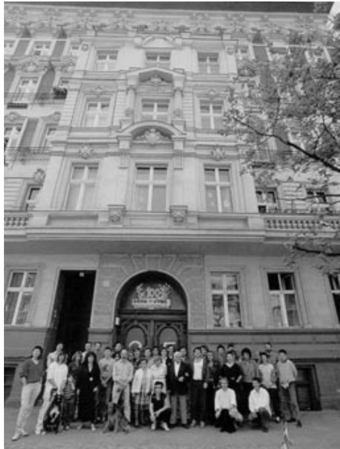
BewohnerInnen der Winterfeldtstraße