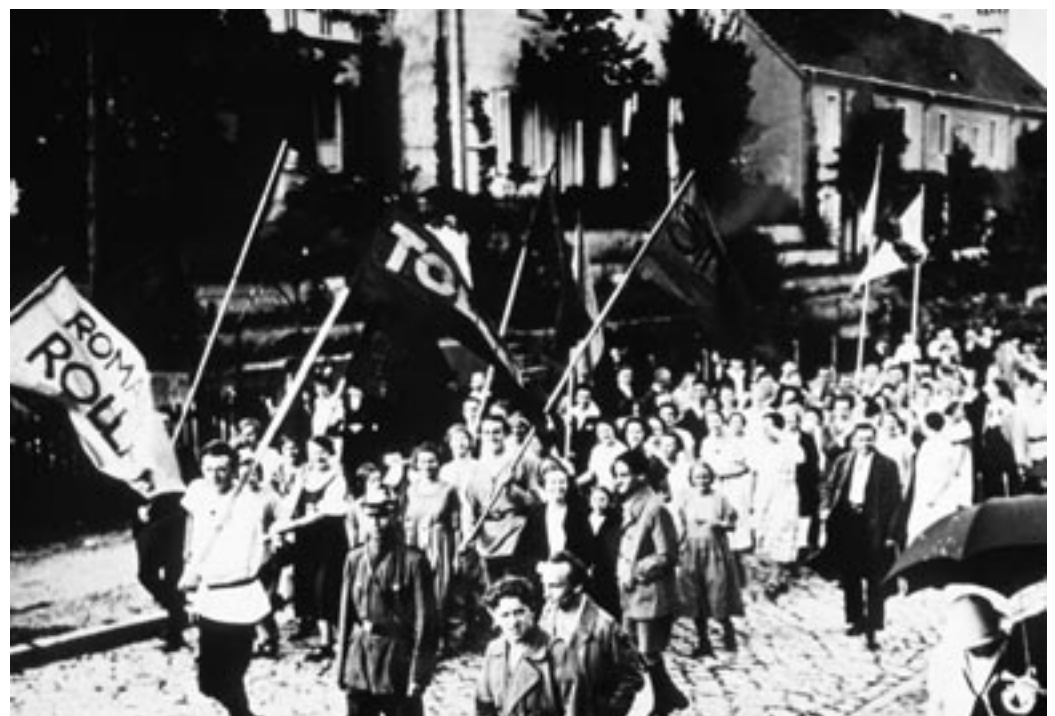
Dada-Straßenfest in der Tautsiedlung.

Arbeiterklasse übereinstimmen können, und welche nicht“. Nun wandte der alt gewordene Mann sich angesichts des behaupteten „Endes der Geschichte“ und des scheinbar totalen Sieges des Kapitalismus in Berlin noch einmal jener schönsten unter den großartigen Berliner Siedlungen zu, trotz alledem und wie zur Gegenbehauptung. Britz war für ihn eine Hauptstadt im Lande der konkreten Utopie.