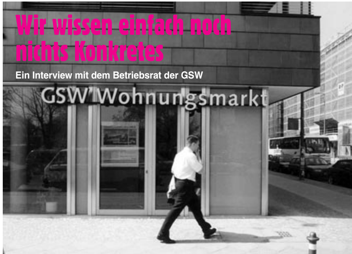
Geschäftsstelle der GSW

Für die Mieter kommt nur eine Lösung in Betracht, die die GSW in staatlichem Eigentum erhält.