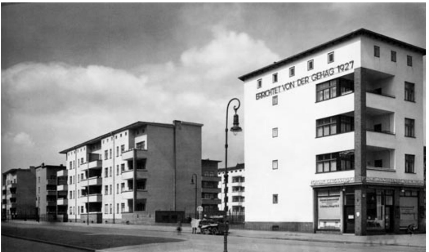
Wohnanlage Prenzlauer Berg erbaut für die GEHAG um 1927