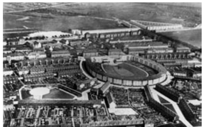
Luftaufnahme der Hufeisen-Siedlung im Bestand der GEHAG. Foto um 1930

zwischen Individuen und Gesellschaft – die Erde sollte, wie Bruno Taut emphatisch schrieb nunmehr allen eine gute Wohnung werden. Im so gewonnenen „Außenwohnraum“ wurden Rasenteppiche für die spielenden Kinder ausgelegt