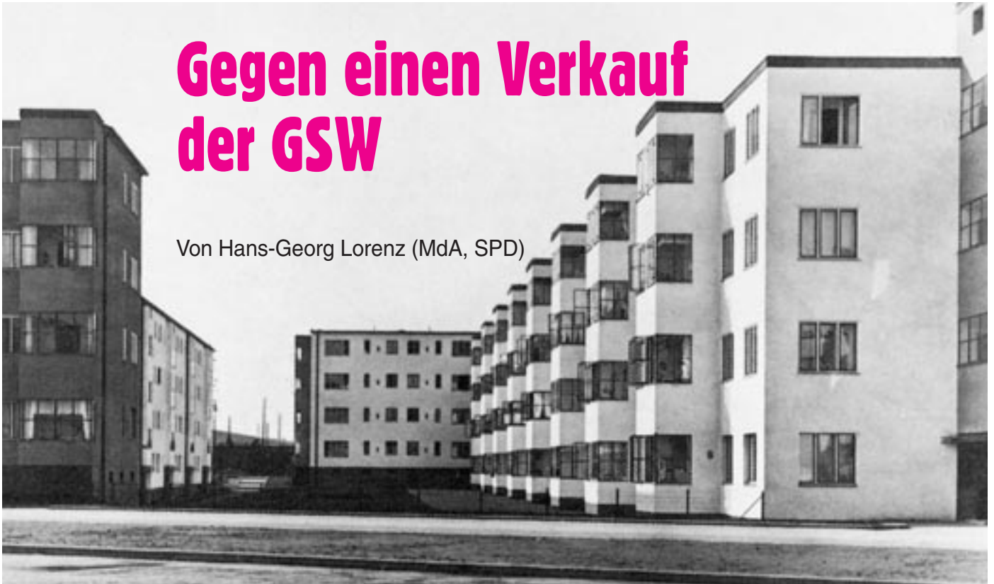
Friedrich-Ebert-Siedlung im Bestand der GSW, erbaut um 1930