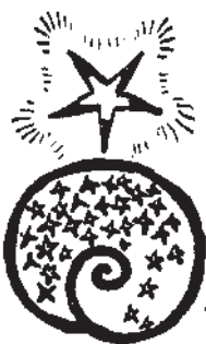
Titelvignette aus Bruno Tauts Buch „Die Stadtkrone“ Holzschnittprägung 1919

„Stadtkrone“, nämlich „...Besseres wollen. Es gibt eine Kraft, die überschreitet die Grenzen, der