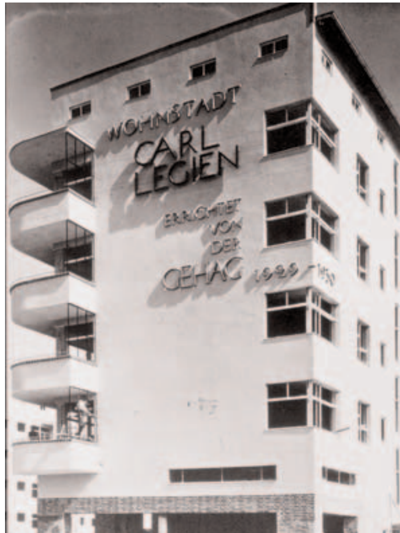
Die Carl-Legien-Siedlung im Bestand der GEHAG, erbaut um 1930

Was Smith für Amerika beschreibt, braucht für Berlin nur um Nuancen verändert werden: Schuld sind hier vor allem die Kommunisten, die Türken, alle Staatsalimentierten in ihren Hängematten! Und natürlich die Herren Wagner, Taut, Scharoun, Graffunder, Novy, Hämer. Alles unter dem Motto: „Reißt sie ein die gebauten Gemeinheiten! Füllt die Löcher im Spekulationskuchen. Je privater unsere Städte und Gemeinden, desto mehr Selbstherrlichkeit und Würde. Bürger macht mit!“