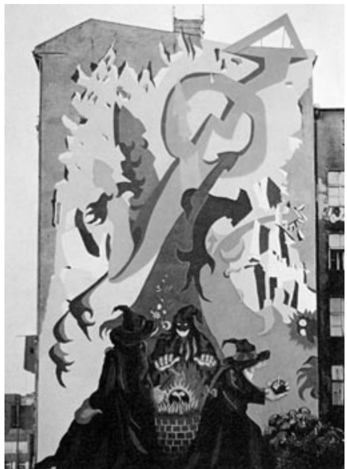
Hausfassade des KuKuCK

Eine solche Politik entlastet den öffentlichen Haushalt durch die Trinkgelder aus dem Verkauf überhaupt nicht. Sie schafft das Fundament für ungeheure Belastungen in der Zukunft und sie stellt zielsicher die Weichen für eine neue Wohnungsnot. Eine solche Politik verdient Widerstand. Ya Basta!