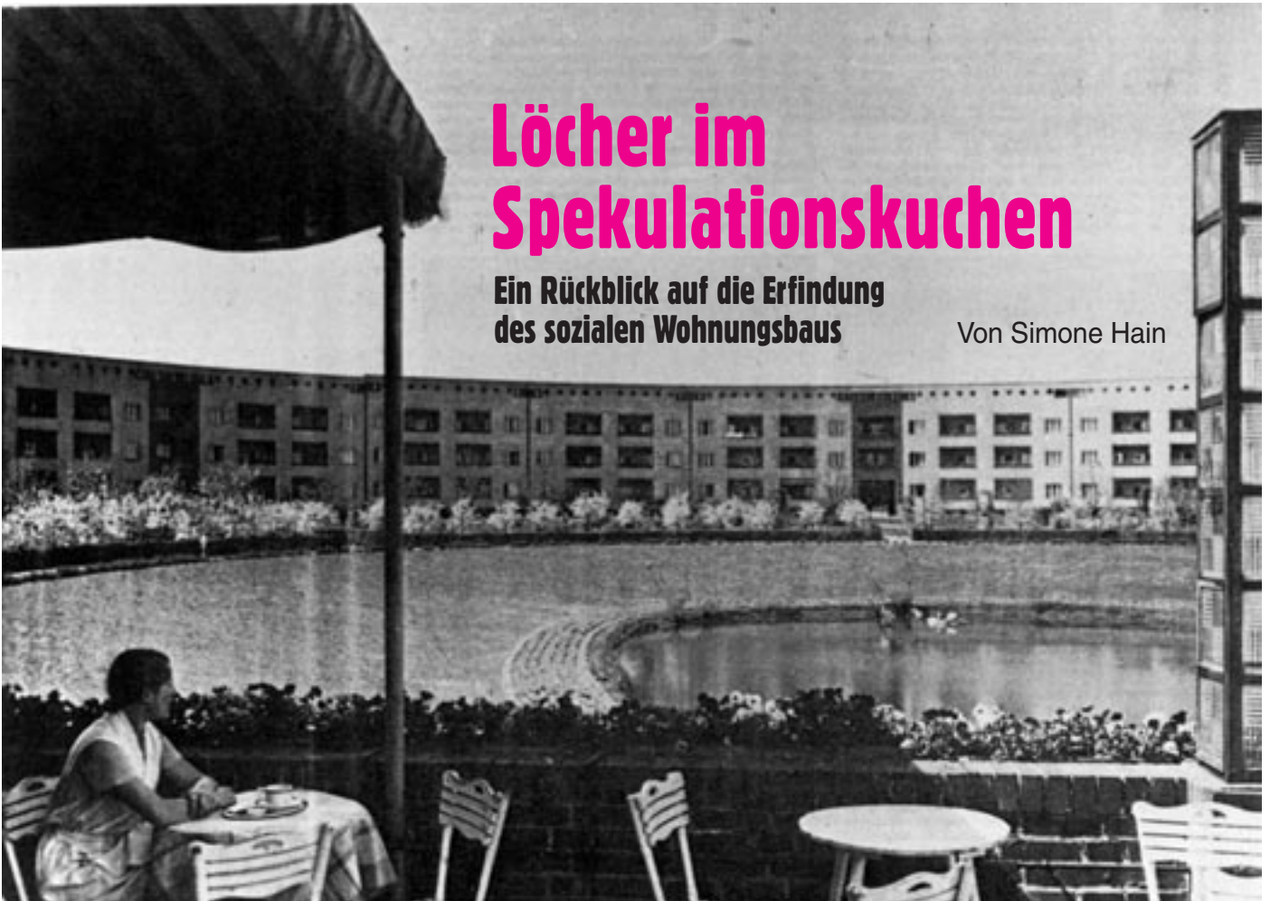
Blick in die Hufeisen-Siedlung im Bestand der GEHAG.