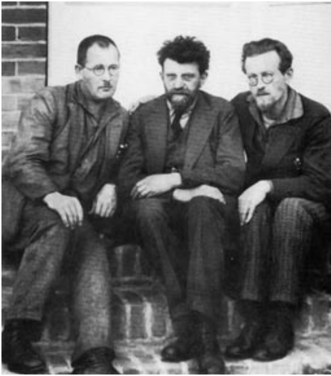
„Revolutionäre“, Erich Mühsam (Mitte) mit Freunden.