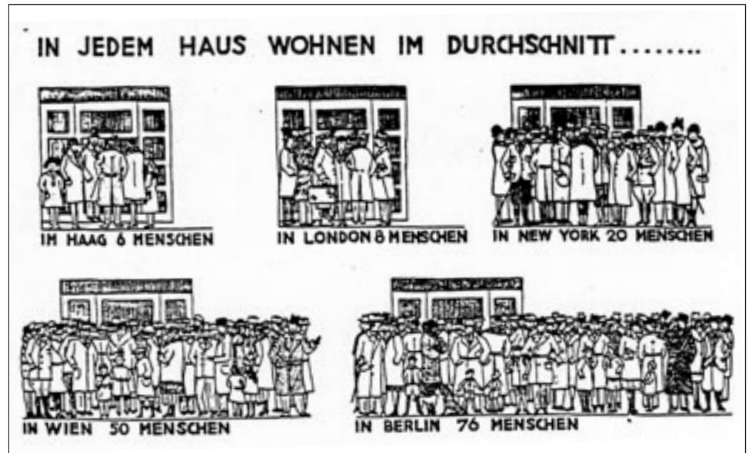
Karikatur aus GEHAG-NACHRICHTEN, um 1930

1918. Zwar hatte seit 1910 ein weiter Konsens unter Stadtplanern und Reformern darin bestanden, die Kommunalisierung des Bodens zu fordern, doch erst mit den Wahlen von 1920 errangen die sozialistischen Kräfte eine Zweidrittelmehrheit und konnten mit Unterstützung von Teilen der Demokraten schließlich das „Gesetz über die Bildung der neuen Gemeinde Berlins“ in Kraft setzen. Damit entstand nach Los Angeles flächenmäßig die zweitgrößte Stadt der Welt, die umgehend mit