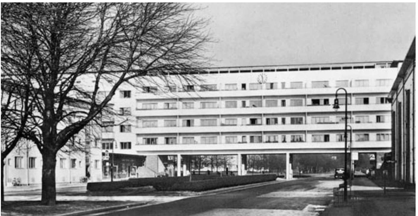
Laubenganghaus der „Weißen Stadt“ im Bestand der GSW, erbaut um 1930

Die Leidtragenden sind die Mieterinnen und Mieter. Bei vielen Verkäufen städtischer Wohnungen haben sie die Auswirkungen erfahren müssen. Es ist von daher wichtig, dass Kritik an den Verkäufen von GSW und GEWOBAG von allen Seiten laut und heftig wird. Dazu sind Briefe an CDU und SPD Abgeordnete oder Unterschriftensammlungen ebenso wichtig wie Aktionen von Mieterinitiativen in betroffenen Häusern. Die SPD wird auf ihrem nächsten Parteitag eine Diskussion zu diesen Verkäufen führen, auch dort sollten betroffene Mieterinnen und Mieter ihren Unmut nachdrücklich deutlich machen.