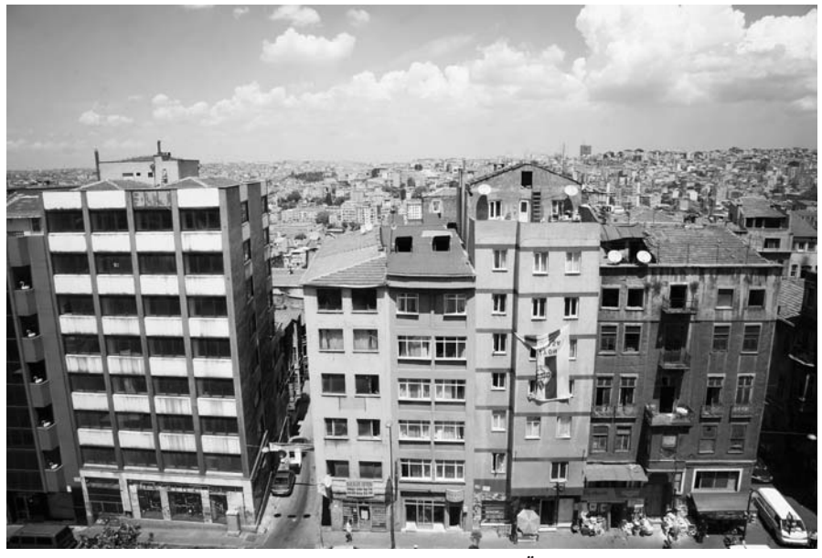
Der geplante Abriss des Altbauquartiers Tarlabaşı wurde im Jahr 2006 der Öffentlichkeit bekannt. Tarlabaşı grenzt an den aufstrebenen Stadtteil Beyoğlu. Neben Tarlabaşı sind weitere Stadtteile Istanbuls von Abriss bedroht.

Die Bürgerinitiativen ließen sich daraufhin auf die Verhandlungen ein, während linke Gruppen diese boykottierten. Ihrer Meinung nach können ohne militanten Druck nur kleine kosmetische Veränderungen bewirkt werden, während die von der Stadtverwaltung gewollte Umwandlung des Viertels im Großen und Ganzen durchgesetzt werde. Das Ergebnis der Verhandlungen ist noch offen.