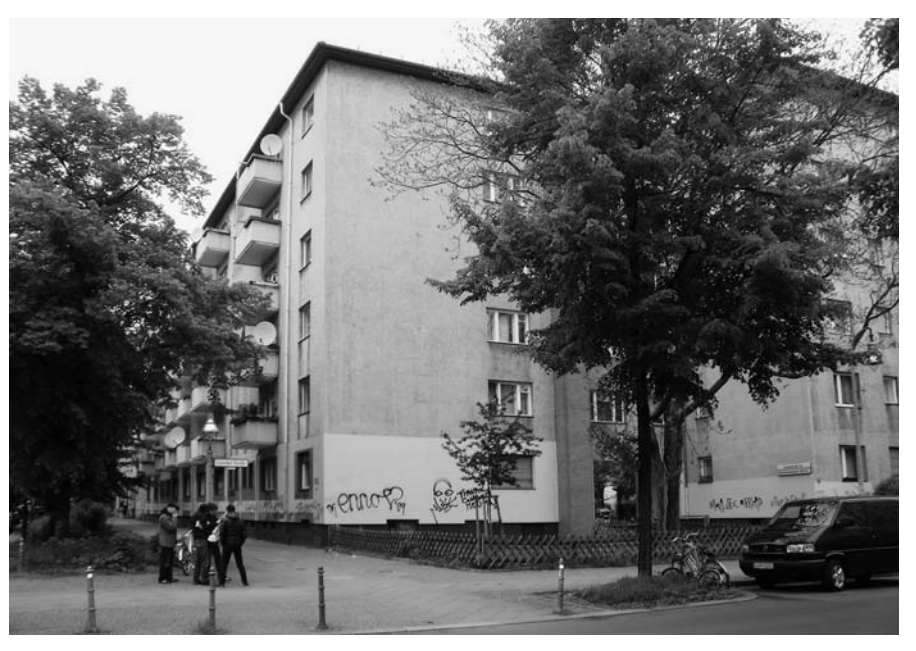
Wohnhäuser der Gagfah an der Reichenberger Straße in Kreuzberg .

Trotz Börsenflop sind auch die Wohnungen der GSW, die Mieter/innen und vor allem die Mieteinkünfte noch da. Zwar soll laut Immobilien Zeitung "nicht einmal ein Viertel des maximalen Emissionsvolumens im Orderbuch gestanden haben", bevor Goldman Sachs und Cerberus "die Notbremse zogen", dennoch sei die Börse weiterhin das Ziel. Ob an der Börse oder nicht, am Geschäftsmodell der GSW wird sich nicht viel ändern. Im Prospekt zum GSW-Börsengang ist das Modell erklärt und es findet