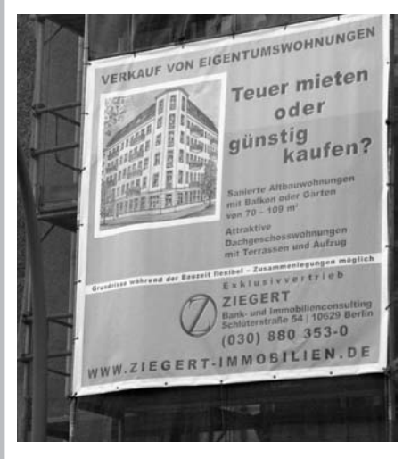
Werbung der Firma Ziegert an einem Fassadengerüst. Mieter/innen, die weder eine hohe Miete bezahlen noch ihre Wohnung kaufen können, scheinen zum zum Auszug gezwungen zu werden.

Als besondere Dienstleistung wird von Ziegert ein "Mietmanagement" angepriesen. Denn, so behauptet die Firma: "Professionelles Mietmanagement ist im klassischen Aufteilungsgeschäft und bei Durchführung von umfangreichen Sanierungsvorhaben nicht mehr wegzudenken. (...) Unsere motivierten Mitarbeiter führen hierbei eine Vielzahl von qualifizierten Gesprächen und/oder Verhandlungen mit den Mietern und versuchen, Interessenkonflikte