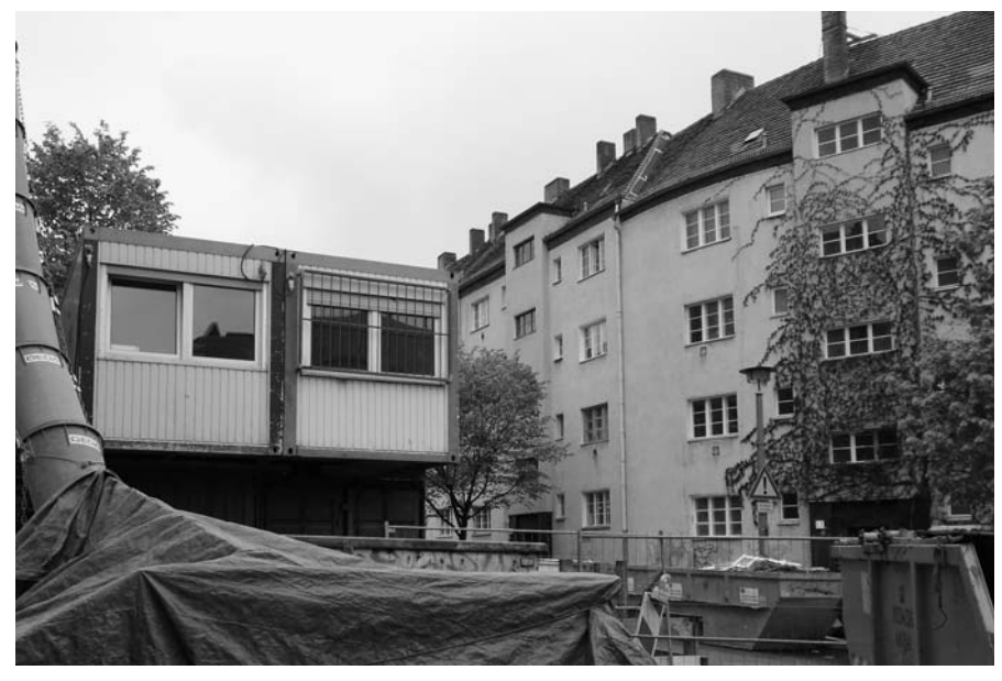
Mit einer Umstrukturierungssatzung werden die Vermieter verpflichtet, bei der Modernisierung ein Sozialplanverfahren durchzuführen. Der tatsächliche Nutzen für die betroffenen Mieter/innen ist fragwürdig.

Fraglich ist zudem, was mit den Mieter/innen geschieht, wenn die Zweijahresfrist vorbei ist. Die Vermieter werden die Miete entsprechend der modernisierten Wohnungsausstattung und dem Mietspiegel erhöhen können – maximal 20% innerhalb von drei Jahren. "Wer kümmert sich dann darum, dass die Mieter/innen in ihrem gewohnten Wohnumfeld bleiben können?" fragt Carola Handwerg. "Es sind sehr viele ältere Mieter/innen darunter, die schon mehr als 20 oder 30 Jahre dort wohnen, und die müssten dann umziehen - und die Hartz-IV-Beziehenden sowieso." Nach Meinung der Rechtsanwältin sei es "die beste Lösung, den Umfang der Maßnahmen zu minimieren, z. B. das Bad nicht voll zu verfliesen, kein wandhängendes WC mit Unterputzspülkasten, kein Handtuchheizkörper, keine Isolierglasfenster, keine sichtbegrenzende Müllstandsfläche. Das sind alles Sachen, die die meisten nicht vermisst haben und der Verzicht darauf hält die Miete nahe am Mietspiegel-Mittelwert."