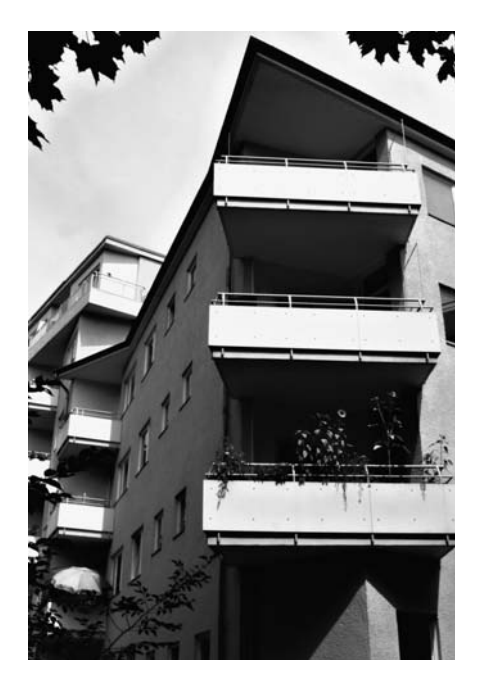
GSW-Wohnungen am Halemweg in Charlottenburg.

Mit dem Schritt ist nun für die Eigentümer Cerberus und Whitehall (einer Fondsgesellschaft der US-Investmentbank Goldman Sachs) der Weg frei, einen Mehrheitsanteil oder auch das komplette Unternehmen an die