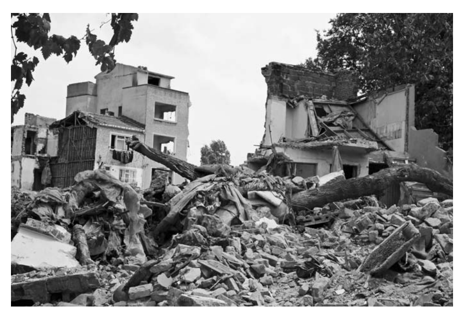
Das Istanbuler Stadtviertel Sulukule wurde bereits weitgehend abgerissen. Sulukule liegt innerhalb der historischen Stadtmauer und gilt mit seiner 1000-jährigen Geschichte als die älteste Roma-Siedlung der Welt.

Auch immer mehr historisch gewachsene Innenstadtquartiere sollen den Abrissbaggern