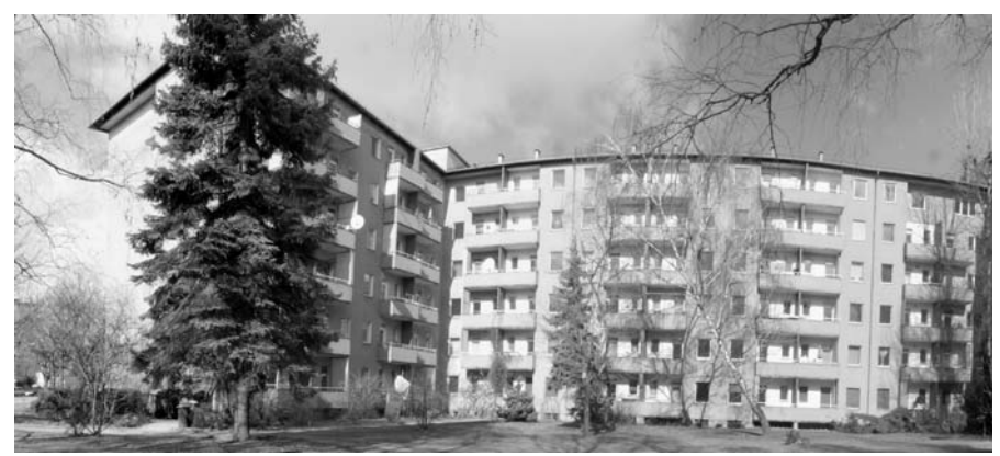
Hofseite der Barbarossastraße 59/60 in Schöneberg.

Wenn in Schöneberg Verdrängung stattfindet, dann aber richtig. Hier sollen die oberen Mittelschichten ihr Domizil finden. Es stören nur die Mieter/innen, denn die teilen die Investorenlogik keineswegs. Sie wissen, dass der Abriss des Hauses nicht nur die Vernichtung ihrer Wohnung bedeutet, sondern auch den Verlust ihres sozialen Umfelds. Die