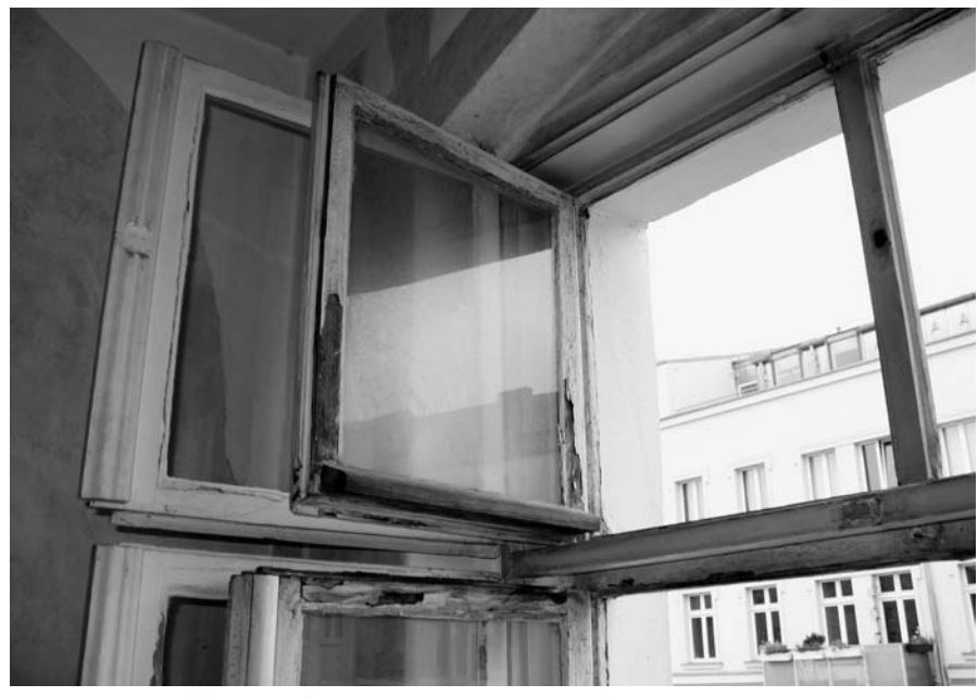
Auch wenn die Fensterfarbe von außen abblättert: Das Streichen der Außenseite von Fenstern bleibt grundsätzlich Sache des Vermieters. Zu den Schönheitsreparaturen im Sinne des § 28 Abs. 4 Satz 3 der II. Berechnungsverordnung gehört nur das Streichen der Fenster von innen.

im überwiegenden Umfang zur Ausführung der Schönheitsreparaturen verpflichtet. Unter Änderung des Urteils des Amtsgerichts hat es dem Vermieter einen Teil des Schadenersatzes zuerkannt. Es führte zur Begründung seiner Entscheidung aus, dass die Klausel zur Ausführung der Schönheitsreparaturen in einen wirksamen und einen unwirksamen Teil aufgespalten werden könne. Es hielt lediglich den Teil der Klausel für unwirksam, der dem Mieter das Streichen der Türen und Fenster unter Einschluss der Außenseiten auferlegte sowie ihn zum Abziehen und Versiegeln des Parketts verpflichtete, weil dieser Teil den Mieter unangemessen benachteilige. Die übrige Regelung zur Durchführung der Schönheitsreparaturen sei wirksam.