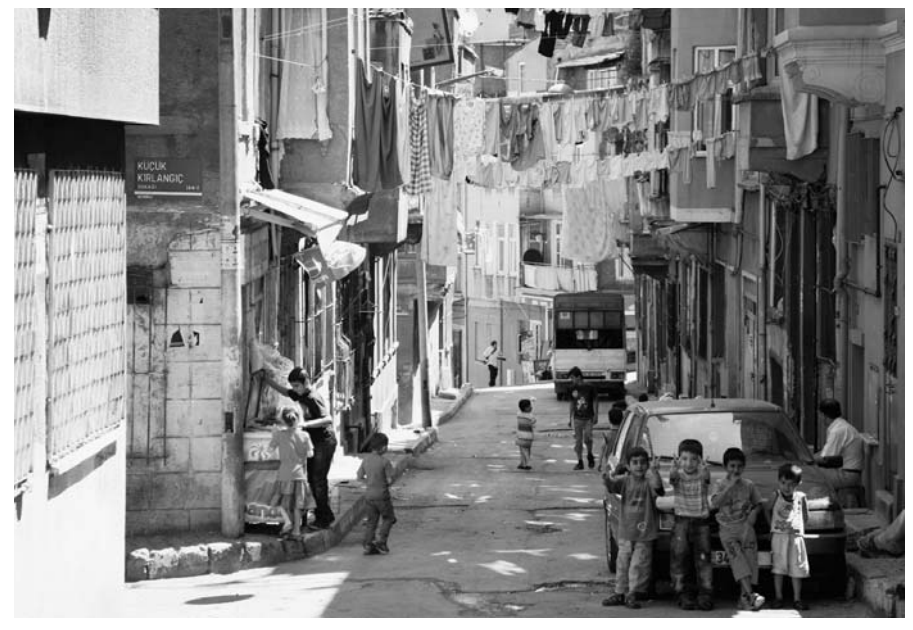
Das Stadtviertel Tarlabaşı ist Zufluchtsort für Außenseiter und Randgruppen Istanbuls. Nach einem Beschluss der Stadtverwaltung soll das historische Viertel fast vollständig abgerissen und die Bevölkerung vertrieben werden.

Doch diese Nischen sind im Selbstverständnis des neuen modernen Istanbul nicht mehr vorgesehen. Die Stadt entwickelt sich im inter-