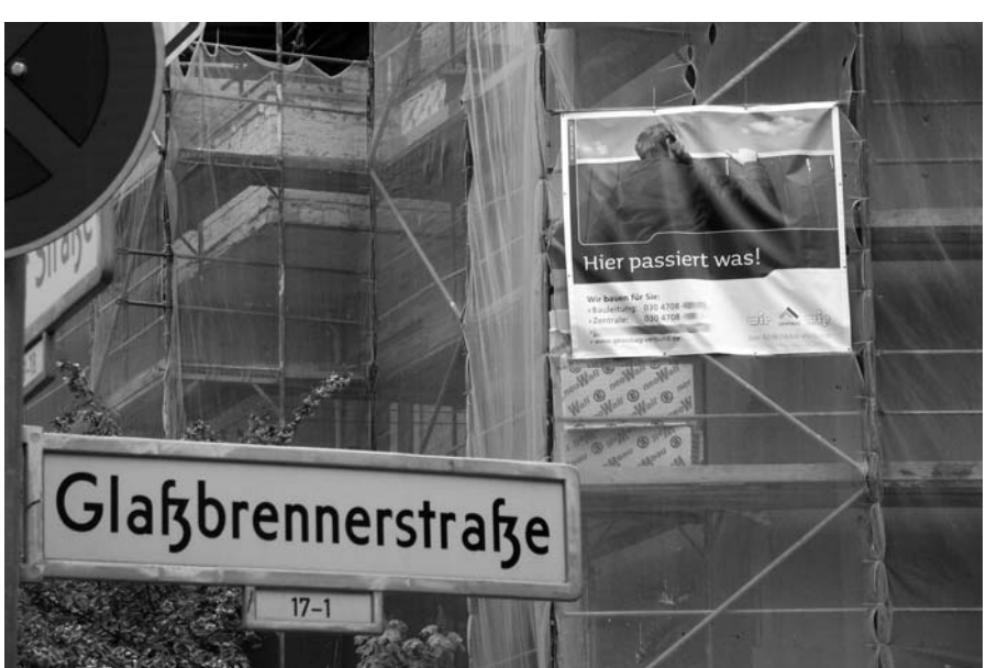
Die Wohngebäude aus den 20er Jahren werden modernisiert – Mieterhöhungen sind angekündigt.

Die Gewobag, die im Wohngebiet an der Schieritzstraße (siehe folgender Beitrag) durch Missachtung der milieuschutzrechtlichen Genehmigungsauflagen aufgefallen war, lenkte als erste ein. Dagegen sträubte sich das Unternehmen der Sonnenschein Privatstiftung gegen die bezirkliche Einmischung und fing ohne Baugenehmigung zu bauen an. Nach einem vom Bezirksamt verhängten Baustopp ließ man sich anschließend auf Verhandlungen ein. Laut einer dabei getroffenen Vereinbarung wird die Mieterberatung Prenzlauer Berg GmbH eingeschaltet, um die Konditionen der Modernisierung mit den Mieter/innen und den Eigentümern individuell auszuhandeln. Dabei sollen die Mieten nach Abschluss der Modernisierung für bestimmte einkommensschwache Gruppen für zwei Jahre festgelegt werden. Für diejenigen, die ALG II oder die Grundsicherung im Alter beziehen, sollen die Mieten die Höchstgrenzen für die Übernahme der Wohnkosten nicht überschreiten. Bei Bezieher/innen von Wohngeld soll die Miete nicht mehr als 30% des Einkommens betragen. Darüber hinaus sollen für die Dauer des Mietvertrags keine Eigenbedarfskündigungen