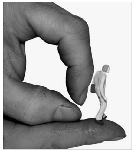
Drohender Rauswurf: Für den Vermieter wird es immer einfacher, Mieter/innen aufgrund von Eigenbedarf die Wohnung zu kündigen.