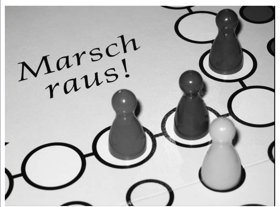
Wer bleiben darf, entscheidet der Geldbeutel. Ohne aktive Wohnungspolitik droht eine soziale Spaltung.

sinkenden Realeinkommen noch das jüngst vorgestellte grüne Ideal von energetisch hocheffizienten und über das gesamte Stadtgebiet verteilten Wohnungen zu günstigen Mieten. Preissteigerungen bei den Bestandsmieten und vor allem bei Neuvermietungen bei gleichzeitigem Mangel an preisgünstigen Wohnungen bedrohen und betreffen immer mehr Haushalte. So muss eine zunehmende Zahl von Mieter/innen eine immer höhere