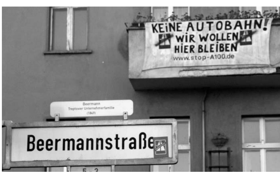
Viele Anwohner/innen protestieren gegen den Weiterbau der A 100 wie hier in der Treptower Beermannstraße.