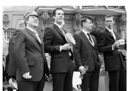
Studenten einer Studentenverbindung während der jährlichen Verbandstagung des Coburger Convents. Der Coburger Convent ist ein Dachverband von rund 100 schlagenden und farbentragenden Studentenverbindungen. Zu diesen zählt die Berliner Studentenverbindung Corps Teutonia jedoch nicht.

Anfangs war ein raues Klima zu spüren, was allerdings noch nicht bedrohlich war. Beispielsweise kamen ständig Leute vorbei und wollten einen zum Trinken animieren – um so den einen oder anderen in die Verbindung zu nötigen. Das haben sie nur teilweise geschafft. Von uns sieben, die da gewohnt haben, sind