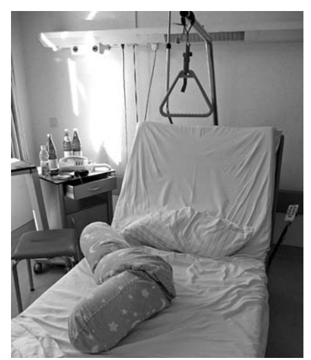
Durch den Druck der Finanz- und Wirtschaftskrise könnte das Thema Krankenhausprivatisierung wieder auf die Tagesordnung kommen.

Wie sich die Krise, die nach Ansicht der Industrielobby eine so gute Ausgangssituation für Steuerentlastungen und Privatisierungen bietet, in Berlin auswirkt, beschreibt die IHK in