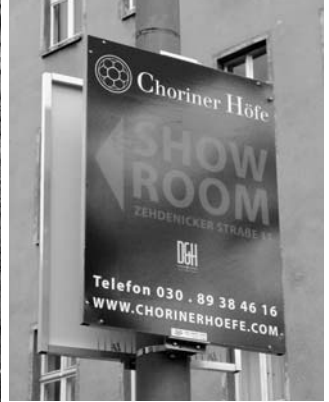
Links: Protest der Mieter/innen an der Christinenstraße 16/17. Rechts: Wegweiser zum Showroom der Choriner Höfe.