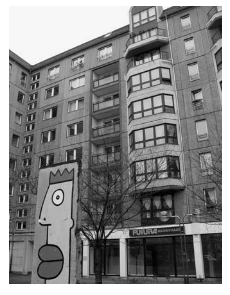
In der Wilhelmstraße werden vom Eigentümer zahlreiche Wohnungen als Ferienwohnungen angeboten. Der dagegen protestierenden Anwohnerinitiative wurde untersagt, von einer "Hotelnutzung" zu sprechen.

Was können Anwohnerinitiativen also tun, um nicht allzu leicht mit Klagen überzogen zu werden? Denn auch wenn derartige Reaktio-