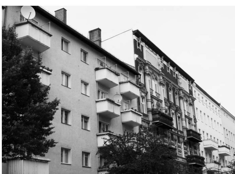
Immer teurer werden vor allem die früher besonders günstigen Wohnungen. Die Mieten der unsanierten Gründerzeitaltbauten und der 50er-Jahre-Gebäude sind laut Mietspiegel überdurchschnittlich gestiegen.

Diese Klasse gehörte zu den preiswerten Segmenten. Die Wohnungen wurden zwischen den Kriegen zum großen Teil von sozial orientierten Wohnungsbaugesellschaften errichtet, hatten einen für damalige Zeiten hohen Wohnstandard, der wenig Raum für mietsteigernde Modernisierungen ließ. Doch auch hier entfalten sich die Marktgesetze: Eine immer weniger zahlungskräftige Mieterschaft