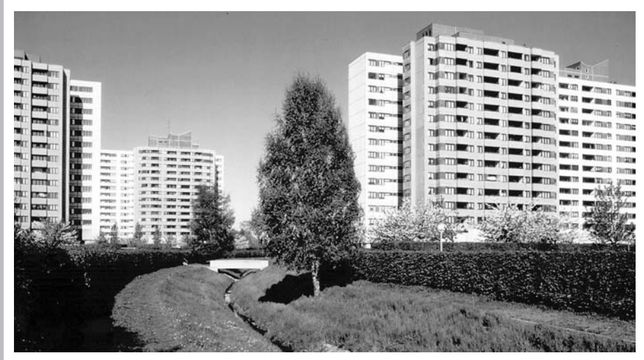
Die Großsiedlung Märkisches Viertel wurde von 1963 bis 1974 gebaut und war mit ihren ca. 17.000 Wohnungen für bis zu 50.000 Bewohner ausgelegt. Das Märkische Viertel liegt im Bezirk Reinickendorf, Ortsteil Wittenau.

Während an einigen Hochhäusern bereits gebaut wird, deutet bisher nur eine unscheinbare Ausstellung im Stadtteilzentrum Fontane-Haus auf den Umbau der öffentlichen Plätze hin. Im Gästebuch beschweren sich Besucher/innen über lange Wartezeiten auf dem Bürgeramt oder über "herumlungernde Jugendliche" auf den Tischtennisplatten. Dazwischen finden sich einige wenige Anregun-