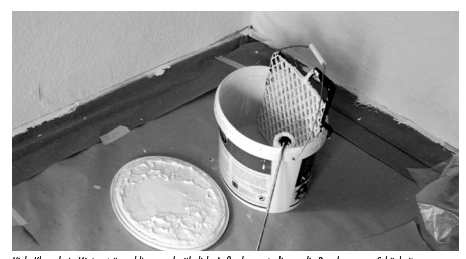
Viele Klauseln in Mietverträgen klingen sehr ähnlich. Außerdem unterliegen die Regelungen zu Schönheitsreparaturen einer sich ständig ändernden Rechtsprechung. Mieter/innen sollten deshalb bei Fragen immer eine Beratungsstelle aufsuchen und sich zu dem individuellen Problem anwaltlich beraten lassen.

Nachdem die Renovierungsklauseln in vielen Mietverträgen unwirksam waren, meinten die Vermieter, sie müssten höhere Mieten nehmen, indem sie die Zusatzkosten einkalkulierten. Einige Vermieter versuchten dies über einen gesonderten Zuschlag bei der Mieterhöhung durch Anpassung an die ortsübliche Vergleichsmiete nach dem Mietspiegel (§ 558 BGB). Dem BGH wurde ein solcher Fall zur Überprüfung vorgelegt. Die Richter entschieden, dass der Vermieter nicht berechtigt sei, im Rahmen einer Mieterhöhung nach § 558 BGB einen Zuschlag zur ortsüblichen Miete zu verlangen, wenn der Mietvertrag eine unwirksame Klausel zur Übertragung der Schönheitsreparaturen enthalte. Die Berechnung eines Zuschlags würde ein Kostenelement einführen, das im freifinanzierten Wohnungsbau nicht vorgesehen sei. Außerdem habe grundsätzlich der Verwender von Formularklauseln das Risiko der Unwirksamkeit zu tragen (BGH, Urteil vom 9. Juli 2008, Az: VIII 181/07).