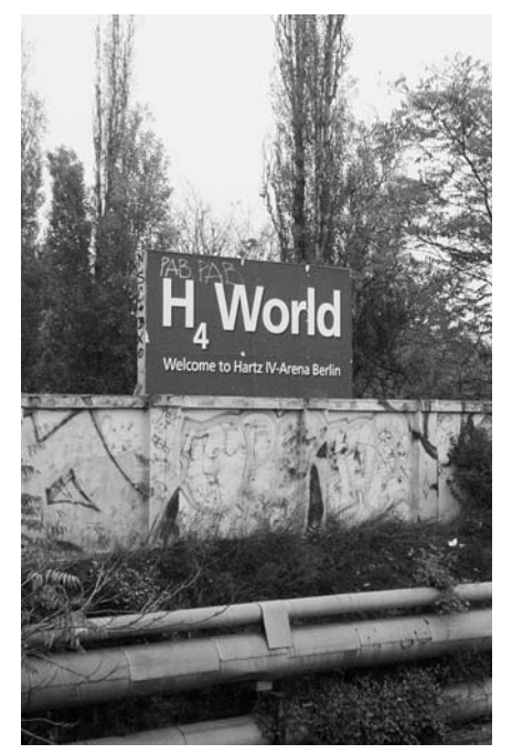
Anfang November 2007 war dieses Schild auf dem Gelände des RAW-Tempels errichtet worden – gut sichtbar von der Warschauer Brücke aus und in unmittelbarer Nähe zur 0<sub>2</sub>-World.

Der Erfolg der Mieter/innen der Rochstraße 9 wurde mit großer Beachtung aufgenommen, weil Beschwerden von Mieter/innen über die Beeinträchtigung durch Werbebanner keine