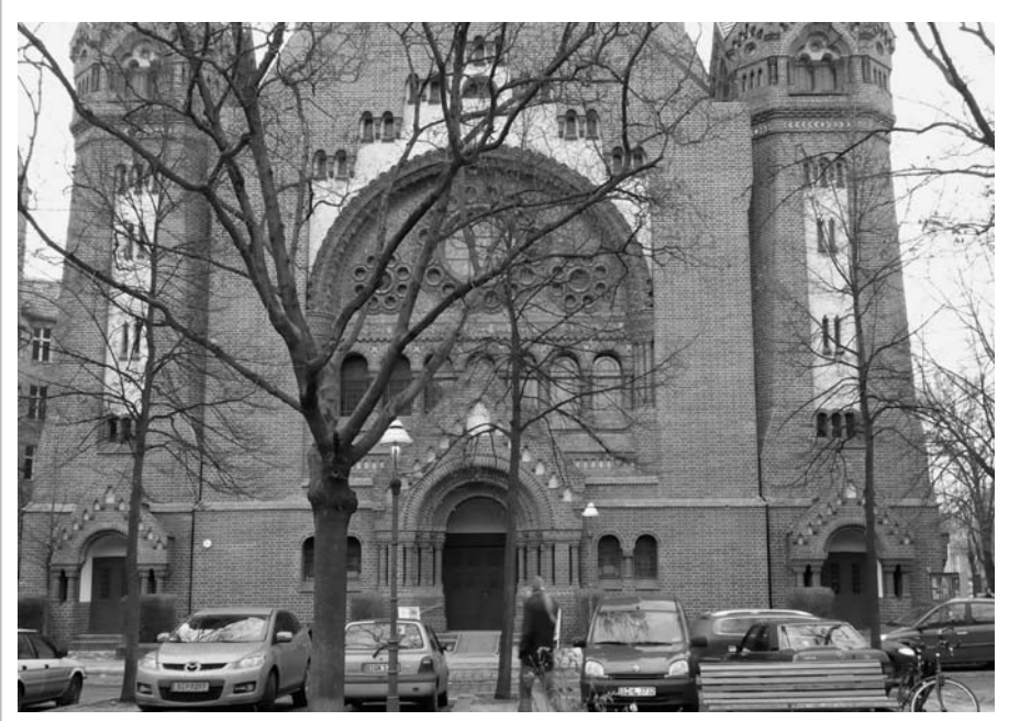
Die Passionskirche am Kreuzberger Marheinekeplatz ist eine der ca. 45 Ausgabestellen der Berliner Tafel und der Aktion Laib und Seele für Lebensmittel.

Gemeinsam mit den Kirchen und dem Rundfunk Berlin-Brandenburg (RBB) arbeitet die Berliner Tafel in der Aktion Laib und Seele zusammen, die mittlerweile 45 Ausgabestellen in Kirchengemeinden unterhält, wo Bedürftige einmal in der Woche Lebensmittel für einen Euro erhalten. Hierzu muss die Bedürftigkeit z. B. mit einem Hartz-IV- oder einem Rentenbescheid nachgewiesen werden. Weiterhin betreibt die Berliner Tafel vier Kinderund Jugendrestaurants. Hier soll Kindern eine