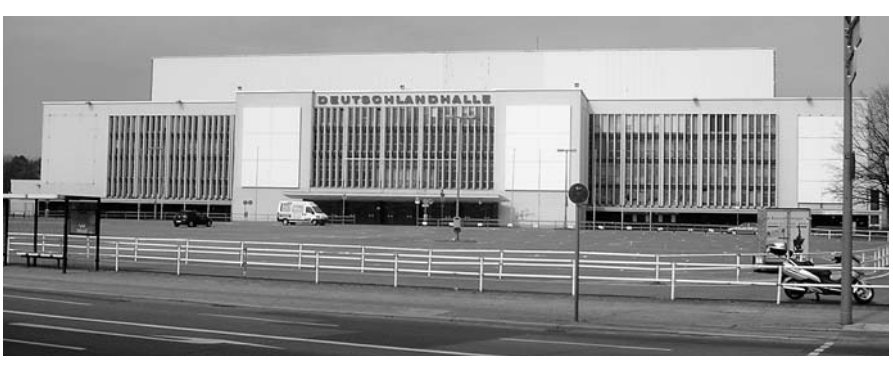
Oben: Die unter Denkmalschutz stehende Deutschlandhalle, die zur Messe Berlin gehört. Die über ca. 10.000 Sitzplätze verfügende Halle wurde 1935 fertiggestellt und nach Kriegsschäden wiederaufgebaut. Die letzte Sanierung erfolgte erst 1997 bis 2001. Der Abriss der Deutschlandhalle wurde im Mai 2008 vom Senat beschlossen.

Liegt also alles an der verkorksten Olympiabewerbung und ihren Folgen? Hören wir uns eine offizielle Einschätzung des Senats aus dem Jahr 2001 an: "Die Betreibung von drei im wesentlichen identischen Großhallen, die sich zudem im Eigentum des Landes Berlin befinden, durch zwei in Konkurrenz zueinander stehende Hallenbetreiber würde negative Auswirkungen für den für Großhallen relevanten Veranstaltungsmarkt nach sich ziehen. (...) Von einer derartigen Konkur-