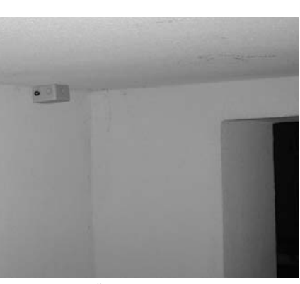
Videokamera zur Überwachung der Mieter/innen in der Bödikerstraße 9/10.

lich selbst gemerkt zu haben - die Kündigungen wurden nicht weiter verfolgt. Dafür konzentrierten sich die Eigentümer auf die Renovierung des zweiten Hinterhauses, das leer stand. Dort wurden moderne Lofts errichtet, die schnell Käufer fanden. Zwischen den neuen Käufern und den alten Mieter/innen gibt es bisher lose Kontakte. Von den Kameras hätten auch die Bewohner/innen der Lofts nichts gewusst und sie seien darüber nicht erfreut, konnte ein Mieter des ersten Hinterhauses in Erfahrung bringen. Er hat gegen die Überwachungsgeräte eine Klage eingereicht. Darüber wird allerdings erst in den nächsten Monaten entschieden. Solange wollte der gegen die Überwachung klagende Mieter nicht warten und erwirkte über seinen Rechtsanwalt Max Althoff eine einstweilige Verfügung. Bis zur Verhandlung bleiben die Kameras außer Betrieb. Auf die juristische Klärung dürfen Berliner Mieter/innen gespannt sein.