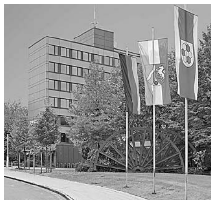
Rathaus in Bergkamen, einer Stadt mit gut 50.000 Einwohner/innen am östlichen Rand des Ruhrgebiets. Mitte 2006 wurde in Berkamen die Müllentsorgung rekommunalisiert und wird nun durch einen kommunalen Eigenbetrieb ausgeführt. Die Abfallgebühren wurden seitdem um 30% gesenkt.

liarden Euro) und den kommunalen Abwasseranlagen (58 Milliarden Euro). "Klar erkennbar wird der immer noch vorhandene Nachholbedarf in den neuen Bundesländern", stellt das Difu fest. Dort müssten allein 24% aller erforderlichen Finanzmittel konzentriert werden, um den nach wie vor existierenden Rückstand gegenüber den alten Bundesländern auszugleichen. Bei Ersatzinvestitionen beträgt der Anteil in den neuen Bundesländern nur 47%. "Eine Ursache dafür ist in den umfangreichen Investitionen nach der Wiedervereinigung zu sehen", heißt es in dem Bericht. "Werden Unterhalt und Erneuerung der Infrastruktur vernachlässigt, so führt dies langfristig nicht nur zu höheren Kosten sowie zum Rückgang von Wachstum und Produktivität. Auch die Nutzer kommunaler Infrastruktur könnten gefährdet, die Leistungsfähigkeit beeinträchtigt werden – beispielsweise im Gesundheitsbereich oder in Schulen – und