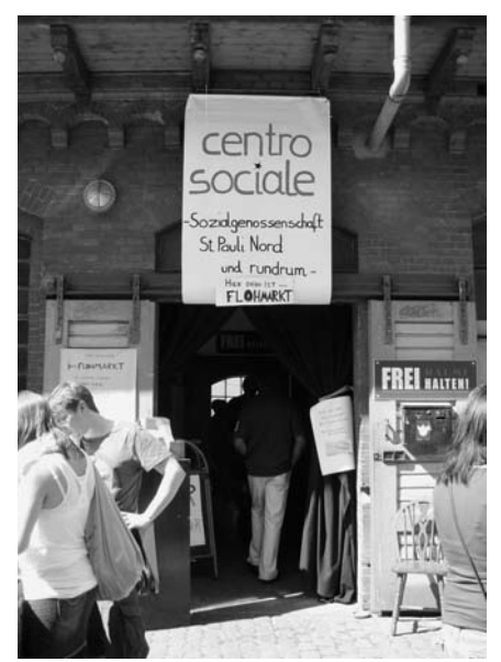
Für das Centro Sociale wurde die Sozialgenossenschaft St. Pauli Nord und rundrum eG gegründet.

gegen die Macht des Gelds spielt dabei eine große Rolle. Innerhalb weniger Monate ist ein Angebot gewachsen, das von Fahrradselbsthilfe, gemeinsamer Suppenküche, Montagsmalen für alle und Erwerbslosentreff bis zur Weihnachtsbäckerei reicht. Es gibt Tanz- und Sprachkurse, Flohmärkte, Bücherbasare, Theaterproben, Jamsessions, Arbeits- und Bautreffen, offene Wohnzimmer und jede Menge politischer Einzelveranstaltungen. Im Haus treffen sich feministische, antifaschistische und globalisierungskritische Gruppen, darunter Avanti, die Rote Hilfe, Mujeres sin fronteras und Attac. Im Juni 2009 steht eine zweitägige Veranstaltung zur Gentrifizierung an.