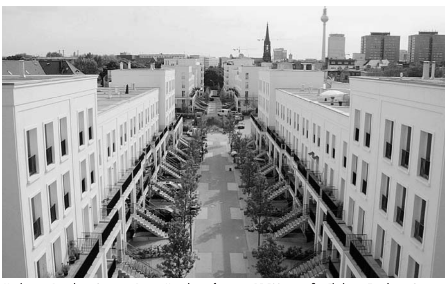
Mit den sog. Prenzlauer Gärten im Bötzow-Viertel ist auf einer ca. 15.500 qm großen Fläche ein Townhouse-Quartier entstanden. Neben 60 Townhouses wurden zahlreiche weitere Wohnungen mit gehobenem Standard, z. T. Penthouses mit Blick auf den Volkspark Friedrichshain, errichtet. "Im Bötzow-Viertel in Berlin-Prenzlauer Berg lebt ein interessanter Mix aus Anwälten, höheren Angestellten, Politikern und Kreativen", so das Marketing der Investoren.

Die Vermarktung des Standorts Berlin bleibt nicht ohne Folgen für den Wohnungsmarkt insgesamt. "Während Objekte in der Innenstadt gefragt sind, werden Außenbezirke abgehängt. Aus Immobiliensicht ist Berlin wieder geteilt, doch statt Ost und West lautet der Gegensatz nun Innen und Außen", beklagt die Industrie- und Handelskammer (IHK). Während sich der Fokus auf das Zentrum richte und die Leerstände schrumpften, sei das Interesse von Nutzern und Anlegern in den Außenbezirken gering, heißt es in einer von der Hochtief-Projektentwicklung und der TLG-