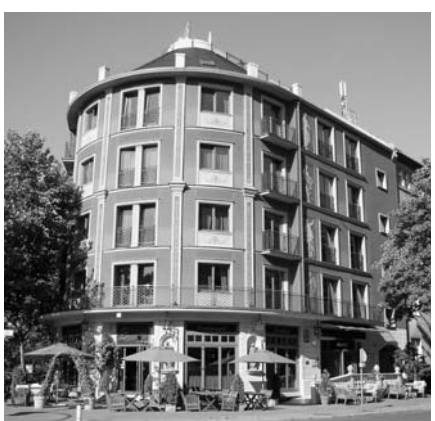
Eckgebäude am Hohenzollerndamm in Wilmersdorf.

Das Allgemeine Gleichbehandlungsgesetz (AGG) – umgangssprachlich auch Antidiskriminierungsgesetz – soll Benachteiligungen aufgrund ethnischer Herkunft, Geschlecht, Religion, Weltanschauung, Behinderung, Alter oder der sexuellen Identität verhindern.