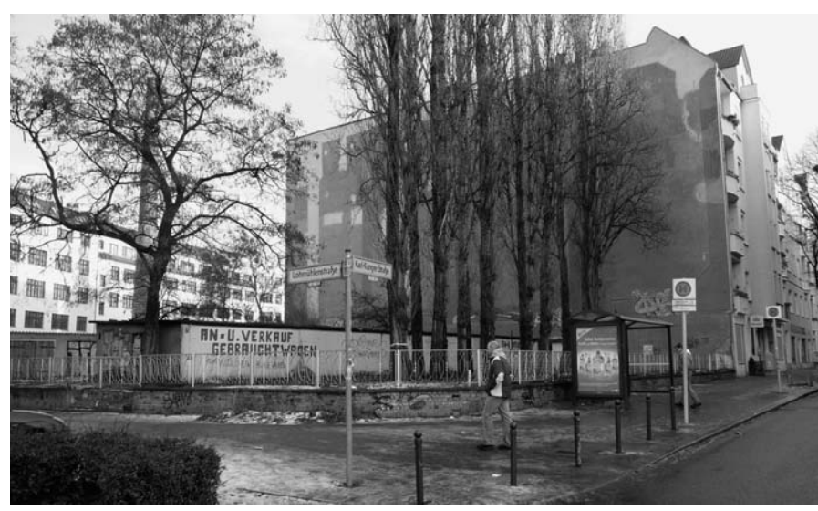
Auf diesem Grundstück an der Ecke Karl-Kunger-Straße und Lohmühlenstraße in Treptow will eine Baugruppe das Projekt "KarLoH" verwirklichen. Für den Neubau ist das Fällen der Pappeln geplant.

Im Kunger-Kiez beabsichtigen zwei Baugruppen direkt gegenüber der um ihre Existenz bangenden Wagenburg den Bau zweier Häuser. An der Ecke Lohmühlenstraße/ Karl-Kunger-Straße sollen die Projekte unter den Namen "KarLoH" und "Zwillingshaus" noch in diesem Jahr entstehen – und etliche Pappeln dafür abgeholzt werden. Solche Bauvorhaben sind natürlich nur machbar, wenn genug Geld als Eigenkapital im Spiel ist. Christian Schö-