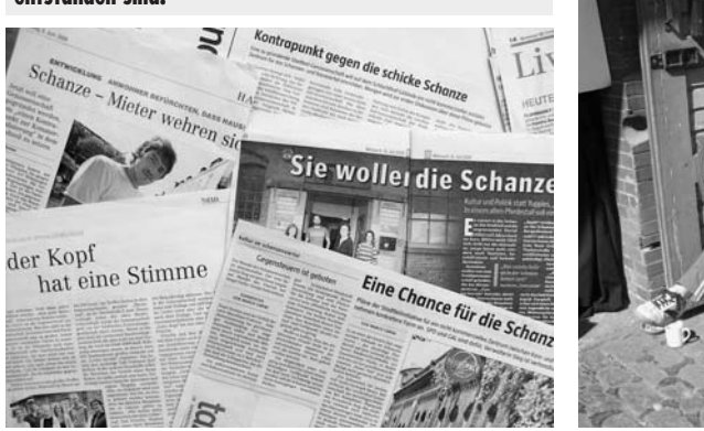
Das Centro Sociale in Hamburg befindet sich in einem einstöckigen Backsteinbau auf dem ehemaligen Schlachthofgelände. Die Gründung im letzten Jahr sorgte für Aufmerksamkeit, auch seitens der Presse.

Der Name Centro Sociale erinnert an die solidarisch arbeitenden und immer wieder politisch umkämpften Sozialzentren, die seit den 70er Jahren in Italien entstanden sind.