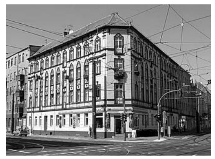
Zentrum Oberschöneweide an der Ecke Wilhelminenhofstraße und Siemensstraße.

architektur. Waren zum Industrialisierungsbeginn bereits über 1400 Arbeiter/innen in der flächenintensiven Kabelproduktion beschäftigt, stieg deren Zahl vom Kaiserreich über die Weimarer Republik und die Zeit des Nationalsozialismus bis zum Ende der DDR auf 25.000 bis 30.000 Menschen, Während für die leitenden Angestellten und Beamten in Richtung Wuhlheide großzügige und komfortable Wohnsiedlungen entstanden, drängten sich die Wohnblöcke der Arbeiter/innen mit geringer sanitärer Ausstattung entlang der Wilhelminenhof- und Edisonstraße. "Zum Ende der DDR waren die ganzen Wohnblöcke entlang der Wilhelminenhofstraße leergezogen", berichtet Killewald, "weil sie zur Straßenverbreiterung abgerissen werden sollten". Doch stattdessen brach die DDR-Industrie zusammen, es blieb weniger als ein Zehntel der Arbeitsplätze übrig, die Facharbeiter zogen weg und die Wohnungen füllten sich mit Menschen mit Wohnberech-