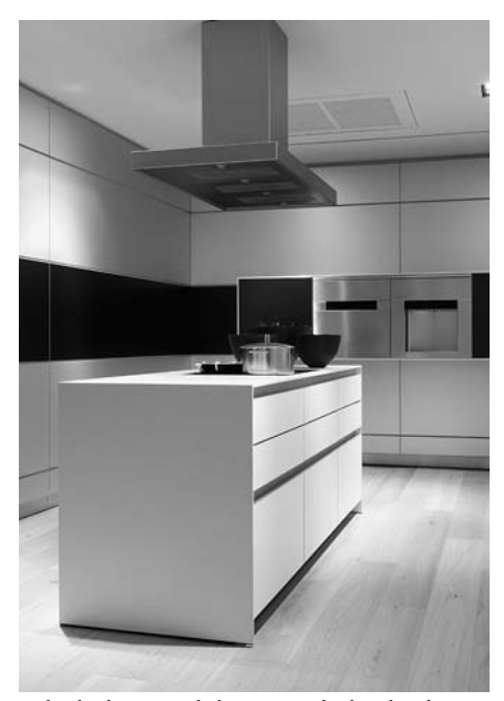
Einbauküchen mit gehobenem Standard sind in der Regel Bestandteil von Luxuswohnungen.

"High-Class" und "Wellness-Wohnungen" errichtet auch die Vivacon AG. Anfang September hob der Investor die beiden Großprojekte "yoo Berlin" und "Luisenstadt" mit einem Gesamtvolumen von 172 Millionen Euro aus der Taufe. In Zusammenarbeit mit