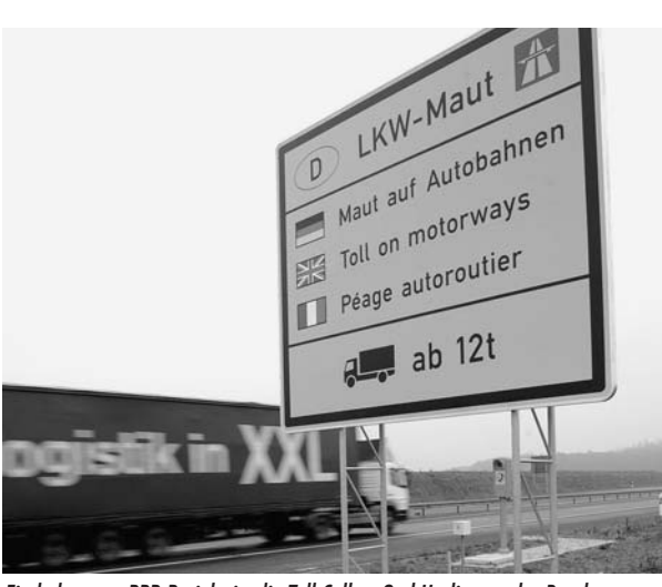
Ein bekanntes PPP-Projekt ist die Toll Collect GmbH, die von der Bundesregierung beauftragt wurde, das System zur Einnahme der Lkw-Maut auf deutschen Autobahnen aufzubauen, zu betreiben und die fälligen Gebühren abzurechnen. Aufgrund diverser technischer Schwierigkeiten ging das System Anfang 2005 mit 16 Monaten Verspätung in Betrieb.

Bei ÖPP-Projekten überträgt die öffentliche Hand einem privaten Unternehmen langfristig, d. h. für einen Zeitraum von oft mehr als 25 Jahren, den Betrieb oder die Bewirtschaftung einer Immobilie oder Einrichtung. Das Unter-