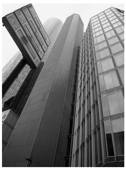
Bankenviertel in Frankfurt am Main.

Konkreter Ausgangspunkt der Subprime-Krise ist eine Verbriefungstechnik, die es Banken erlaubt, ihre Kredite in "forderungsbesicherte Wertpapiere" (Asset-Backed-Securities oder kurz: ABS) umzuwandeln und diese "neu verpackten" Kredite weiterzuverkaufen. An sich ist dies keine neue Technik, sie wurde jedoch in den letzten Jahren exzessiv betrieben. In solchen Wertpapierpaketen können sich Tausende Hypotheken- oder Konsumentenkredite, aber auch Kreditkartenforderungen mit unterschiedlichem Ausfallrisiko – also auch schlechte, d. h. "Subprime"-Kredite – befinden. Die Schuldner zahlen den Kredit nicht mehr bei der Bank ab, bei der sie den