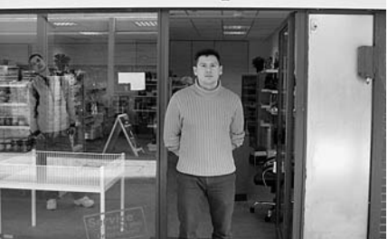
Der erste russische Laden im Falkenhagener Feld West, der im Oktober 2008 eröffnete, ist eines der wenigen Geschäfte vor Ort.

das von den Stadtplanern wie selbstverständlich vorgesehene eigene Auto leisten. So stecken sie in ihren Wohnungen fest und es entsteht eine Tendenz zur Gettoisierung. Außerdem betrage das Wanderungssaldo minus 1,6% pro Jahr, so Fricke. Zu vielen anderen Problemen fehlen ihm die konkreten Zahlen, "dazu bräuchte man eine qualitative Sozialuntersuchung, doch wer soll die bezahlen?"