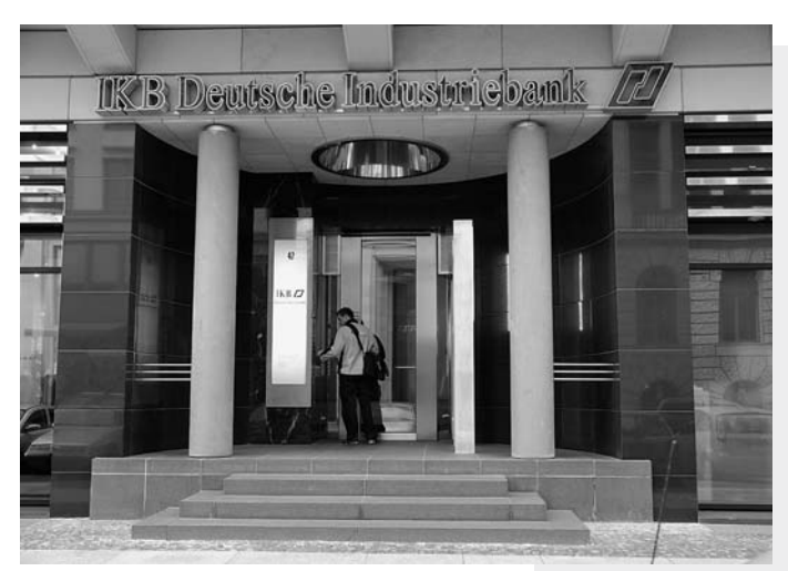
Die IKB geriet bereits 2007 durch ihr Engagement am US-Subprime-Markt in Schieflage.

Trotz aller Warnungen ist von einer sozialen Krise in den hiesigen Debatten wenig zu vernehmen. Das Krisenvokabular beschränkt sich wahlweise auf die Finanz-, Banken- und als besonders schwerwiegend die Vertrauenskrise. Eine Bank könne der anderen nicht mehr trauen, war die allerorts zu vernehmende Klage, als ein Finanzinstitut nach dem anderen in den Strudel der Krise geriet. Wem sollte ein Banker in dieser Situation auch vertrauen? Als Branchenkenner rechneten sie zu Recht damit. dass andere Banken ebenfalls in der Klemme steckten und die Rückzahlung etwaiger Kredite unsicher sei. Da bleibt als Retter in der Not nur der Staat mit seinem von den Bürger/innen finanzierten Haushalt, der in Deutschland rund 283 Milliarden Euro beträgt. "Banken flehen in der Finanzkrise um Hilfe: Der Staat greift ein", titelte die FAZ am 30. September und beschrieb seitenlang die Rettungsaktivitäten in den USA und Europa. Eine absurde Situation, wurde der Öffentlichkeit in den betreffenden Ländern doch seit Jahren eingebläut, dass sich der Staat aus dem Wirtschafts- und Finanzgeschehen heraushalten solle. Die Privatbanken waren stets treibende Kräfte bei der Durchsetzung immer weitergehender "Befreiungen" von staatlicher Reglementierung und Kontrolle. Mit der entsprechenden politischen Flankierung wurde der Boden bereitet, auf dem faule Kreditpapiere weltweit gesammelt und gehandelt werden konnten.