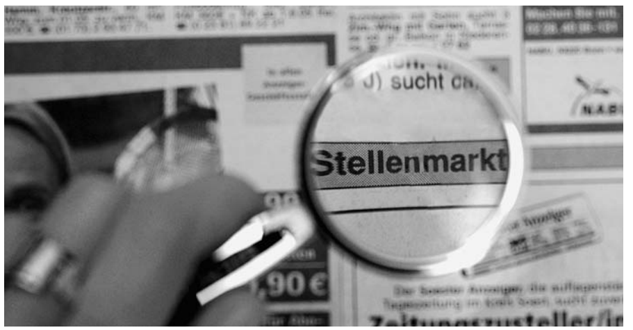
Laut der Studie der Hans-Böckler-Stiftung sind durch Privatisierung und Liberalisierung seit Beginn der 90er Jahre über 600.000 Arbeitsplätze weggefallen.

Obwohl sich die EU als Liberalisierungsmotor erwiesen hat, sehen die Autoren Eingriffsmöglichkeiten auf kommunaler und nationaler Ebene. Schließlich seien es immer die nationalen Regierungen, die auf europäischer Ebene den Liberalisierungsprozess vorangetrieben hätten, insbesondere in den Fällen, in denen es um die "Marktchancen ihrer nationalen Champions" gegangen sei. Auch hätten die Kommunen häufig unabhängig von EU-Vorgaben eine Vorreiterrolle in Sachen Privatisierung übernommen oder Private-Public-Partnership-Projekte auf den Weg gebracht. Das heißt, der Ausverkauf des öffentlichen Eigentums vollzieht sich auf verschiedenen politischen Ebenen. Die Autoren sehen deshalb drei Strategieoptionen, die dem Neoliberalismus entgegengesetzt werden könnten. Erstens: Die Abwehr weiterer Liberalisierungsmaßnahmen und Privatisierungen, die in zahlreichen Sektoren noch zu erwarten sind. Zweitens stünde in Bereichen, in denen der Rückzug des Staats nicht vermieden werden konnte, die sozial- und tarifpolitische Neuregulierung auf der Tagesordnung. Und drittens müsse in den vorhandenen Feldern der öffentlichen Daseinsvorsorge eine politische Stärkung und Demokratisierung angestrebt werden. Als positives Beispiel wird die Auseinandersetzung um die Einführung des Post-Mindestlohns angeführt.