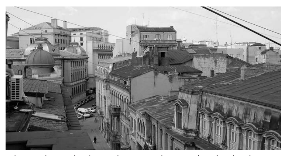
In der Amtszeit des rumänischen Diktators Nicolae Ceauşescu wurden weiträumig historische Stadtviertel zerstört, um monumentalen Zuckerbäckerstil zu errichten. Oben: Das historische Stadtviertel Lipscani mit Blick zur Nationalbank. Unten: Innerstädtische Magistrale in Bukarest mit Brunnen.

Ebenfalls Gegenstand des Verfalls sind die Altbauten, Villen und Bürgerhäuser in der Innenstadt. Bei den meisten bestanden Rückübertragungsansprüche, über die oft in langjährigen Gerichtsverhandlungen gestritten