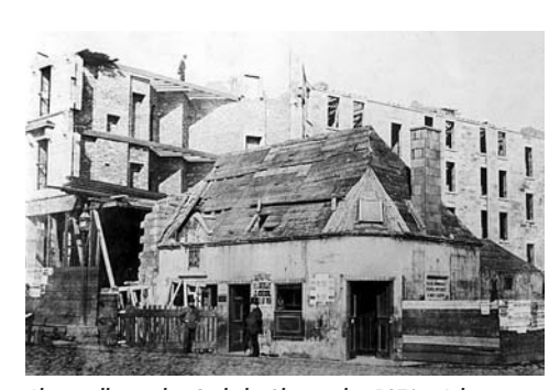
Abrisswellen in den Gorbals: Oben in den 1870er Jahren, unten ein Foto von 1964.

gow Housing Association). Nur so wäre der städtische Haushalt sanierungsfähig, wurde es der hoch verschuldeten Kommune Glasgow nahegelegt. Wir beschreiben im Folgenden, was dieser Wechsel für die Siedlung namens Gorbals bedeutet, die in der angelsächsischen Welt als paradigmatischer Slum bekannt ist.