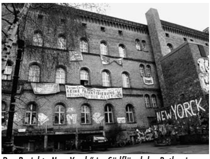
Das Projekt "New Yorck" im Südflügel des Bethaniens.

Sollte bis Jahresende keine Lösung gefunden sein, muss der Bezirk jährlich fast 800.000 Euro an kalkulatorischen Kosten (d. h. fiktive Kapitalverzinsung auf den Herstellungswert, siehe MieterEcho Nr. 323/ August 2007) für das Gebäude aufwenden. Das Bezirksamt arbeitet bereits Pläne für ein Scheitern der Vertragsverhandlungen aus. Die unliebsamen Bethanien-Besetzer/innen loszuwerden, dürfte eine bevorzugte Lösung sein. In Berlin wäre dies die erste Räumung eines bestehenden