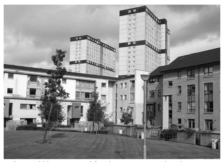
Die Glasgower Gorbals heute: Begrünter Innenhof, umgeben von neuen Eigentums- und Mietwohnungen. Im Hintergrund die alten Punkthochhäuser des sozialen Wohnungsbaus.