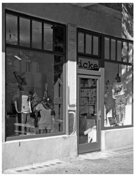
Modelabel in der Friedelstraße in Nord-Neukölln.