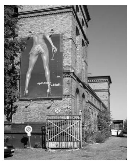
Die Heeresbäckerei an der Köpenicker Straße (Ecke Brommystraße) soll zu Lofts umgebaut werden. Kulturelle Zwischennutzung in Form eines Clubs mit Restaurant gehört hier zur Vermarktungsstrategie.

Der inzwischen professionelle Galeriebetrieb und Förderer junger Kunst "Loop Raum für aktuelle Kunst" entstand 1997 als freies Kunstprojekt in den Edison-Höfen in Mitte. 2001 war er auf der Suche nach neuen