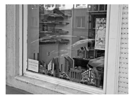
Schaufenster der Zwischennutzungsagentur im Reuterkiez. Die Zwischennutzungsagentur arbeitet mit dem Quartiersmanagement zusammen. Ziel ist, durch Zwischennutzung der leer stehenden Gewerberäume den Kiez aufzuwerten. Sie unterscheiden drei Strategien: Starternutzung für neue Unternehmen, Interimsnutzung (bis zur Wiedervermietung) und befristete Eventnutzung z.B. für Ausstellungen.

Selbstständige – die sogenannten Pioniere – in die Aufwertungsgebiete. Sie verfügen über höhere Bildungsabschlüsse und unterscheiden sich auch in ihren Berufsperspektiven oftmals deutlich von den bisherigen Bewohner/innen solcher Gebiete. Doch hinsichtlich der Einkommen und der Zahlungsfähigkeit gibt es nur geringe Unterschiede. Erst in einer späteren Phase der Gentrifizierung ziehen auch einkommensstärkere Haushalte in das Gebiet und verdrängen über ihre ökonomischen Potenziale die bisherigen Bewohner/innen und die Pioniere gleichermaßen.