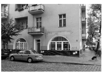
Der Reuterkiez zwischen Landwehrkanal, Kottbusser Damm, Sonnenallee und Weichselstraße ist ein Quartier mit fast geschlossener gründerzeitlicher Altbausubstanz. Die Bevölkerung weist mit jeweils über 30% überdurchschnittlich hohe Anteile von Erwerbslosen sowie Migrant/innen auf. Laut Zwischennutzungsagentur stehen 100 Gewerbeläden leer.

Der wohnungswirtschaftliche Kern von Gentrifizierung ist die ökonomische Aufwertung bisher preiswerter Grundstücke, Gewerberäume und Wohnungen. In der Regel werden solche Wertsteigerungen durch Investitionen ausgelöst, die die Vermietung oder den Verkauf von Wohnungen zu deutlich höheren Preisen ermöglichen (siehe hierzu auch nachfolgendes Interview, die Red.). Der ökonomische Anreiz für die Eigentümer/innen liegt in Gewinnaussichten, die die Investitionen übertreffen. Wohnungswirtschaftler/innen sprechen dabei von der Realisierung der höchst möglichen Rendite. Im Fall einer Gentrifizierung müssten also bauliche Maßnahmen zur Aufwertung der Wohn- und Gebäudesubstanz ebenso zu beobachten sein