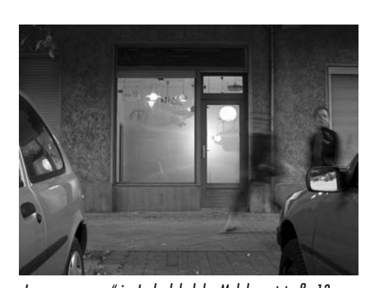
"Lampenmuseum" im Ladenlokal der Malplaquetstraße 13. Die Lampen stammen aus den früher leer stehenden Wohnungen des Mieterhausprojekts.

Das Phänomen der "urbanen Völkerwanderung" ist nicht so einfach in den Griff zu bekommen. Neben Künstlerateliers und Galerien werten zum Beispiel auch Studenten ein Quartier auf. Denen kann man aber doch nicht vorwerfen, dass sie preiswerten Wohnraum suchen. Es ist wie bei einer Kettenreaktion — die Entwicklungen in Prenzlauer Berg und Alt-Mitte führen jetzt zu Nebenwirkungen im Wedding. Die für Investoren günstigen Grundstückspreise tragen ihren Teil dazu bei.