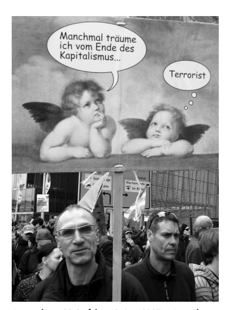
Protest beim G8-Gipfel am 2. Juni 2007 in Rostock.

Solche Organisationen sollten mehr und mehr die Verantwortung für den Wohnungsbestand in ihrer Nachbarschaft übernehmen und gleichzeitig die lokale Machtbasis organisieren, die die öffentliche Hand zu einer Anti-Gentrifizierungs-Gesetzgebung zwingt: Mietpreisbegrenzung, Schutz vor Räumung, verstärkter öffentlicher Wohnungsbau und so weiter. Aber zusätzlich zur lokalen Organisierung sollten Anti-Gentrifizierungsaktivisten mit den globalen Bewegungen für soziale Gerechtigkeit zusammenarbeiten. Die Wohnungsfrage ist eine Frage sozialer Gerechtigkeit, und Gentrifizierung ist Teil einer grö-Beren globalen Kapitalakkumulation. Heutzutage werden viele Gentrifizierungsprojekte