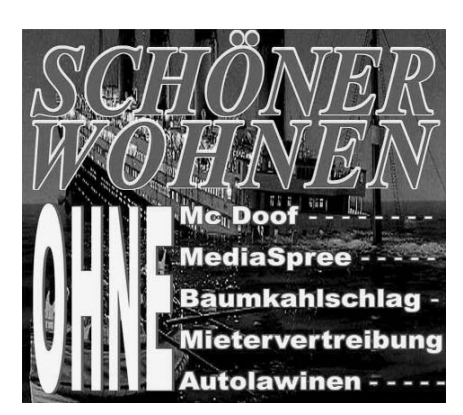
Plakat des "Initiativkreis Mediaspree versenken".

Ein Aktivist des Netzwerks Abriss Berlin, das den Initiativkreis unterstützt, schreibt: "Meine Mitbewohnerin hat ihren Handy-Vertrag bei O<sub>2</sub> mit der Begründung gekündigt, dass sie das Mediaspree-Projekt "O<sub>2</sub>-World" nicht unter-