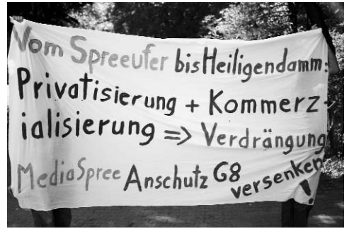
Dieses Transparent der "Bürgerinitiative Media Spree versenken" wurde bei der Veranstaltung aufgrund eingreifender Sicherheitskräfte nicht mehr gezeigt.

Wowereit sieht die Halle "als Schlüsselprojekt für das Gebiet um den Ostbahnhof" und erhofft sich davon "eine Dynamik und neue Perspektiven" für das Umfeld.