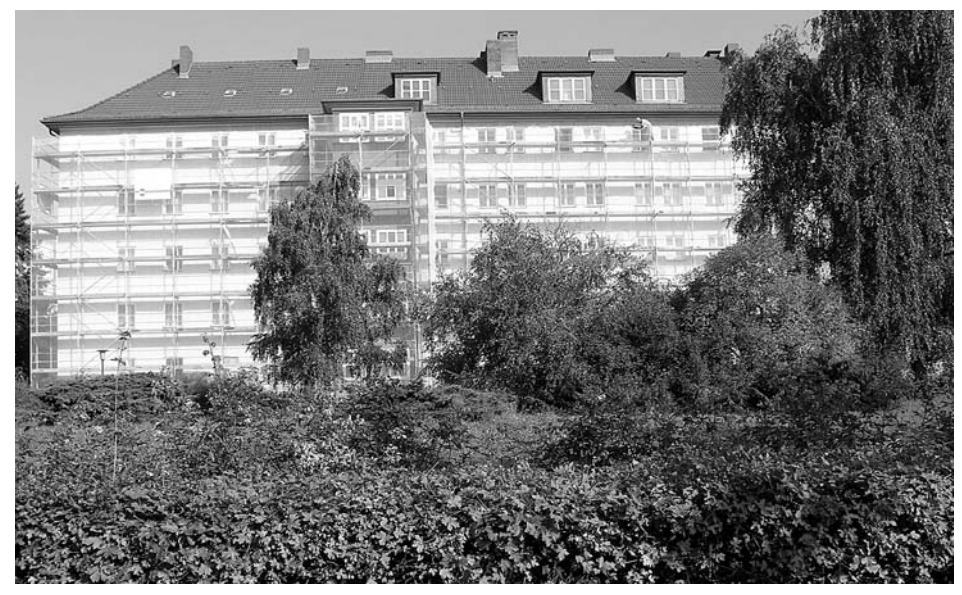
Die Siedlung aus den 1940er Jahren gehörte früher der GSW, die im Mai 2004 an Cerberus verkauft wurde. Bereits wenige Monate später veräußerte Cerberus die Siedlung an die Vivacon AG. 886 der insgesamt 1529 Wohnungen verkaufte wiederum die Vivacon im Dezember 2004 an die österreichische Conwert AG. Die GSW blieb bis heute die Verwalterin und führte ab Frühjahr 2005 Sanierungs- und Modernisierungsmaßnahmen durch. Seitdem sind 15% der Mieter/innen ausgezogen.

seinem Fall die Kosten für Wasserversorgung und Entwässerung um ca. 84%, der Hausstrom um 232% und die Kosten für Hausreinigung sowie Müllabfuhr um knapp 100% gestiegen seien. Zurückzuführen sei dies darauf, dass bei den Modernisierungsbauarbeiten die Hausanschlüsse angezapft worden seien und diesen Mehrverbrauch die Mieter/innen bezahlen sollten. Dass sich ein Widerspruch lohnt, konnten viele Mieter/innen erfahren, denen plötzlich weitaus günstigere Abrechnungen vorgelegt wurden. Eine genaue Überprüfung, wie sie z.B. die Berliner MieterGemeinschaft für ihre Mitglieder anbietet, sollte also von allen Mietparteien veranlasst werden.