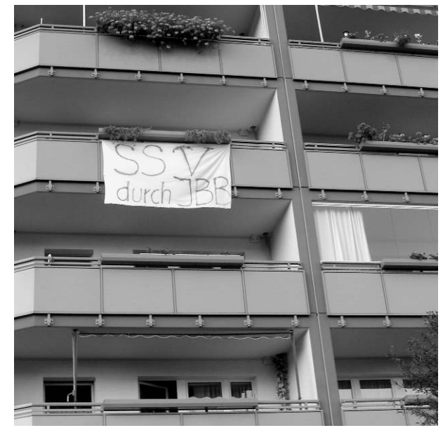
Sommerschlussverkauf durch IBB, Transparent an einer Wohnung der Genossenschaft Eigentum 2000.

zuschüsse sowie der Arbeit und des Geldes der Genoss/innen und Mieter/innen ernten: Der Bestand ist komplett saniert, hat inzwischen einen niedrigen Leerstand von etwa 7%, verfügt über eine Mieterschaft, die durch die Kautionsregelung eng an die Wohnungen gebunden ist und die Wohnungen sind durchaus attraktiv für Eigentumserwerber. Bei Preisen von 900 Euro/gm, die für die sanierte Platte bezahlt werden, ergibt sich eine üppige Gewinnspanne für die Vivacon AG. Über den Umweg der Genossenschaft wurde aus städtischem Eigentum ein profitables Objekt der Immobilienverwertung.