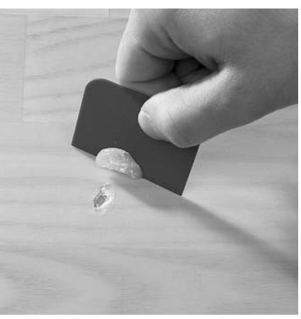
Kleine Schäden im Laminatboden entstehen schnell, wenn mal was runterfällt. Sie lassen sich mit Hartwachs oder speziellen Reparaturpasten ausbessern. Diese sind in allen gängigen Holztönen erhältlich.

Holzfenster müssen gestrichen werden, wenn der Lack Risse zeigt oder sogar das Holz freiliegt. Allerdings sind Mieter/innen nur für die Innenseite zuständig. Zunächst die Scheibenränder und Beschläge mit Malerklebeband abkleben, damit sie vor Kratzern und Lack geschützt sind. Dann lose Teile mit dem Spachtel abheben, den Altanstrich anschleifen und den Staub gründlich abwischen. Beim Lackieren muss man darauf achten, dass keine Farbtropfen, sogenannte Nasen, zurückbleiben. Deshalb den Lack lieber dünn auftragen und nach dem Trocknen eventuell ein zweites