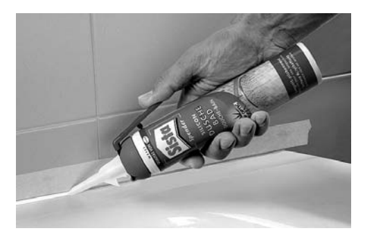
Im Fachhandel gibt es mittlerweile auch Einwegkartuschen mit Silikon, sodass der Kauf einer Silikonspritze entfällt.

Absaugen hat der Teppich noch eine Restfeuchte und sollte etwa zwei Tage trocknen. Brandflecken kann man mit Reststücken (sofern vorhanden) flicken. Mit einem Stanzeisen (im Baumarkt erhältlich) wird die kaputte Stelle herausgenommen und ein neues Stück eingeklebt. Bei größeren Schäden legt man das Reststück in Florrichtung auf die zu ersetzende Stelle und schneidet mit dem Cutter entlang eines Lineals beide Teppichlagen durch. Dann das alte Stück herausnehmen und das neue einsetzen. Wenn Mieter/innen selbst einen Boden (Teppich, Laminat etc.) verlegen, sollte für solche Fälle immer etwas Material aufbewahrt werden.