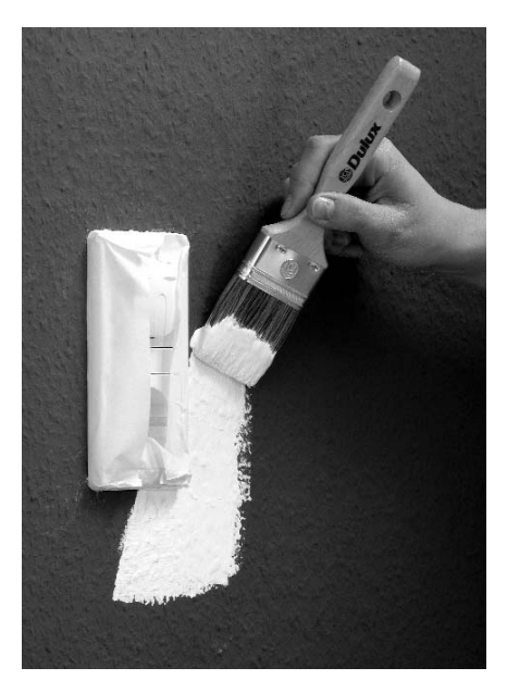
Steckdosen müssen mit Malerklebeband abgeklebt werden. Besser ist, die Verblendungen vorübergehend abzubauen (Sicherungen raus), aber Farbspritzer dürfen nicht in die Dose geraten. Dagegen hilft auch Malerklebeband.

Vor dem Tapezieren müssen Unebenheiten und Bohrlöcher mit Spachtelmasse verfüllt werden. Den pulverförmigen Tapetenkleister rührt man nach den Angaben des Herstellers mit Wasser an. Dann wird die Tapete in Bahnen mit reichlich passender Länge geschnitten und deren Rückseiten mit der Malerbürste bis zu den Rändern mit Kleister bestrichen. Die fertige Bahn anschließend ziehharmonikaartig zusammenlegen und die nächste Bahn einkleistern. Die Bahnen müssen vor dem Ankleben einige Minuten weichen. Da die Wände eines Raums selten rechtwinklig zueinander stehen, sollte man eine Linie mit dem Senkblei anzeichnen, etwa eine Bahnbreite von der Ecke entfernt. Dann wird die erste Bahn geklebt: Den oberen Teil der Tapete entfalten und mit etwas Überstand zur Decke an die Linie anlegen. Mit der Tapezierbürste streicht man die Bahn von der Mitte zu den Rändern hin auf. Oben wird der Knick mit einer stumpfen Schere markiert, dann die Tapete etwas abgehoben, im Knick geschnitten und wieder angeklebt. Unten wird das Ende in die Kante gedrückt, nach oben gefalzt und im Knick abgeschnitten. Die zweite Bahn klebt man auf Stoß mit der ersten und walzt die Nahtstelle anschließend mit dem Kantenroller sauber an. Bei Türen und Fenstern arbeitet man zunächst überlappend