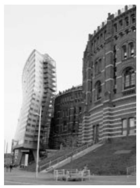
In insgesamt vier Gasometern, die zwischen 1999 und 2001 in Wien-Simmering umgebaut wurden, befinden sich zahlreiche Sozialwohnungen.

schen Grundlagen und die Finanzierung" des Sozialen Wohnungsbaus auf die Agenda gesetzt.