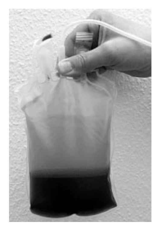
Cerberus ist dabei, für seine Fonds ein umfangreiches Portfolio aufzubauen. Nachdem der US-Fonds Cerberus bereits in 2004 die GSW und weitere Wohnungsbestände erwarb, kauft er sich nun in das Geschäft mit Blutplama ein.