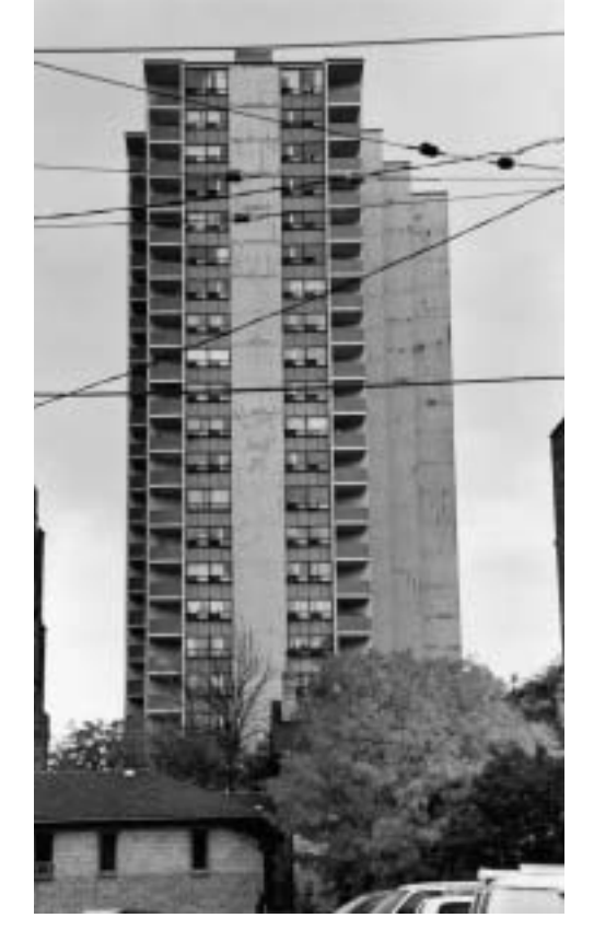
Sozialer Wohnungsbau in Toronto

und sie sei das einzige adäquate Mittel, dem Risiko entgegenzuwirken, dass Mieter/innen ihren Mietzins nicht entrichten, konnten Niedrigverdiener/innen vor Gericht durchsetzen, dass es sich bei dieser Praxis im Gegenteil um Diskriminierung handelt. Die von verschiedenen kanadischen Gerichten gefällten Entscheidungen haben so dazu geführt, dass erstmals – in Kanada und international – juristisch anerkannt ist, dass Diskriminierung wegen Armut ebenso gegen die Menschenrechte verstößt, wie Diskriminierung auf Grund von Geschlecht, Rasse oder Staatsbürgerschaft.