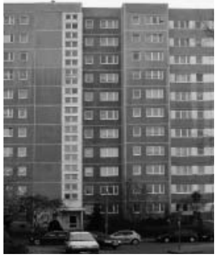
Berlins jüngste Bezirke: Marzahn wurde 1979, Hellersdorf 1986 gegründet.

zögerlich mit dem Phänomen schrumpfende Stadt zu befassen. Im Sommer 2002 nutzte eine Künstlergruppe die zwei mittlerweile abgerissenen Doppelhochhäuser in der Marchwitzastraße für ihre Kulturprojekte. Die Kooperation mit den Bewohnern in der Nachbarschaft war bei ihnen eher zweitrangig.