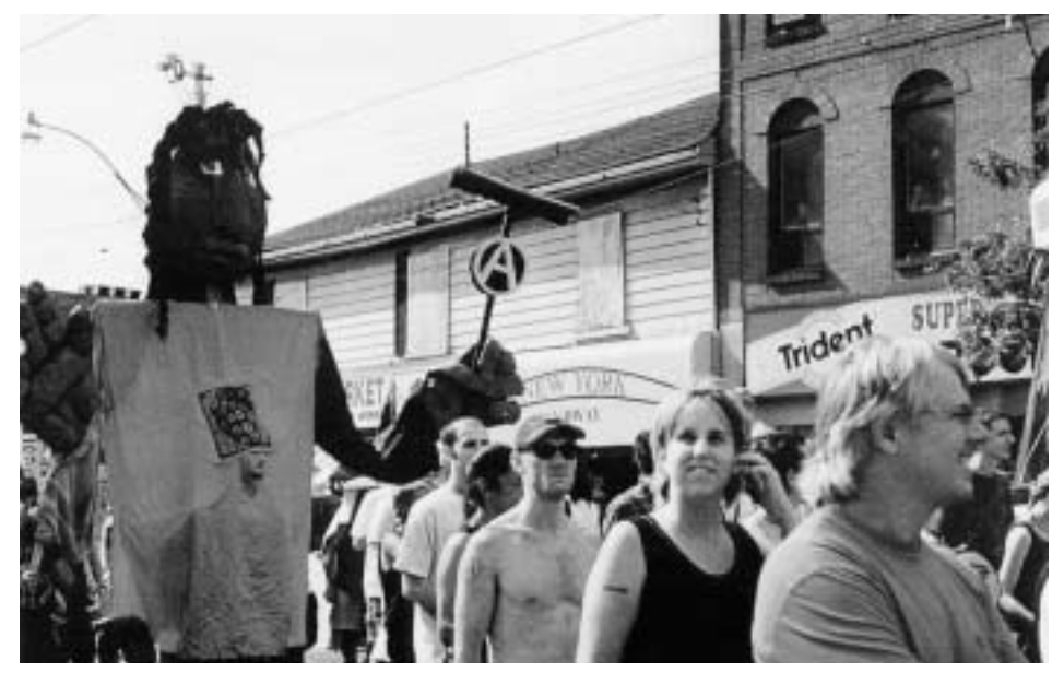
Demonstration des Bündnisses gegen Armut

auch Immigrant/innen und Sozialhilfeempfänger/innen müssen wegen ihrer niedrigen Einkommen regelmäßig deutlich mehr Geld als 30 % für die Miete aufbringen und enden so direkt in den Notunterkünften oder der Wohnungslosigkeit.