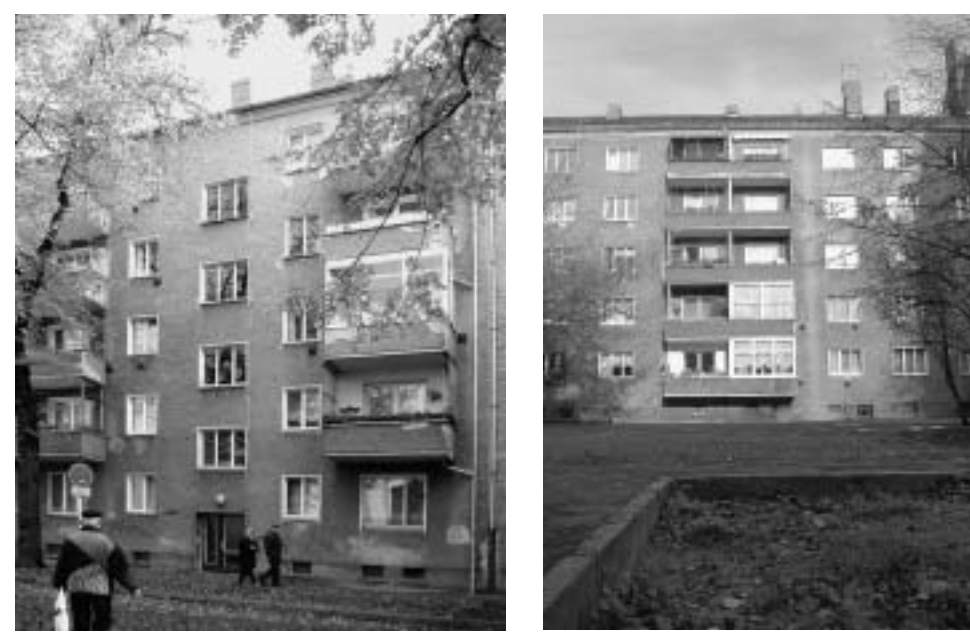
Einer von vielen Gründen für die außerordentliche Vertreterversammlung: Der ehemalige Vorstandsvorsitzende schied auf eigenen Wunsch aus und erhielt eine Einmalzahlung von 510.000 Euro sowie die die Zusage für eine lukrative Pension.

senden Verlusten verstummte nicht. Das Fass zum Überlaufen brachte schließlich der Coup des Vorstandsvorsitzenden, der, als er auf eigenen Wunsch ausgeschieden war, neben 510.000 Euro eine sehr lukrative Pensionszusage mitnehmen konnte.