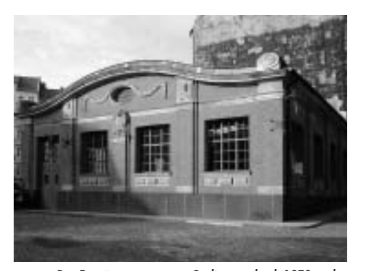
Das Entwässerungssystem Berlins wurde ab 1873 nach Entwürfen von James Hobrecht realisiert. Erst 1909 wurde das abgebildete Pumpwerk Erich-Weinert-Straße in Betrieb genommen. Es steht heute unter Denkmalschutz.

wenn es darum geht, Gewinne durch Gebührenerhöhungen zu erzielen.