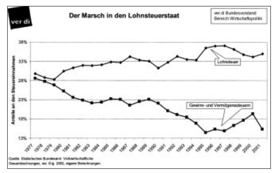
"Vor 25 Jahren war der Anteil der Lohnsteuern am gesamten Steueraufkommen mit rund 30% genauso hoch wie der Anteil der Gewinnsteuern. Heute hat sich das Bild deutlich verschoben. Aus den Gewinnsteuern werden gerade einmal noch 15% der Steuereinnahmen bestritten."

Solange es noch Unternehmenssteuern gibt, können jene Konzerne, die ihre Profite ganz auf die sichere Seite bringen wollen, diese z.B. in die Steueroasen der Karibik transferieren. Während sich einige Leser und Leserinnen vielleicht gar keinen Urlaub mehr haben leisten können, bevorzugen Unternehmen die Cayman Inseln oder die Bermudas. In den Steuerparadiesen erholen sich die Superreichen gleich neben diversen Finanzinstituten. Diese kümmern sich nicht nur um die