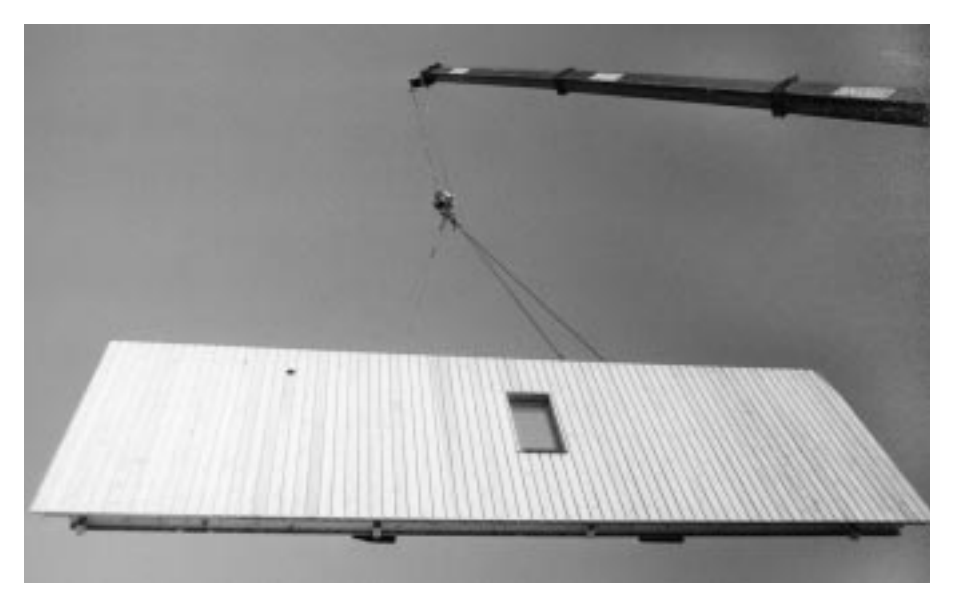
Verschiedene Wege führen zum Wohneigentum

allseits beklagt. In der Tat! Beklagenswert für alle, die vom Wohneigentum ökonomisch profitieren. Aber sonst eine der besten Eigenschaften dieses Landes und ganz besonders seiner Hauptstadt Berlin. Ihre Geschichte als Mieterstadt ist die Geschichte ihrer Emanzipation von mittelalterlicher Rückständigkeit. Zwischen 1654 und 1712 hatte sich die Bevölkerung verzehnfacht, während die Zahl der Feuerstellen nur um das Dreifache zunahm. Die Entwicklung der Gewohnheit des "Zurmietewohnens" beginnt in Berlin zur Zeit des großen Kurfürsten, vor allem im Zuge der Verlagerung der Unterkunft von Offizieren, Beamten und auch des kurfürstlichen Hofes. In Berlin waren die Citoyen immer Mieter, während die kleinbourgoisen Kreise Eigentum bevorzugten. Dies hat sich bis heute nicht geändert, wie die militant antisoziale und eigentumsbornierte AG Bürgerstadt (Hoffmann-Axthelm, Häu-Bermann und Co.) so beklemmend provinziell und geschäftemacherisch beweist.