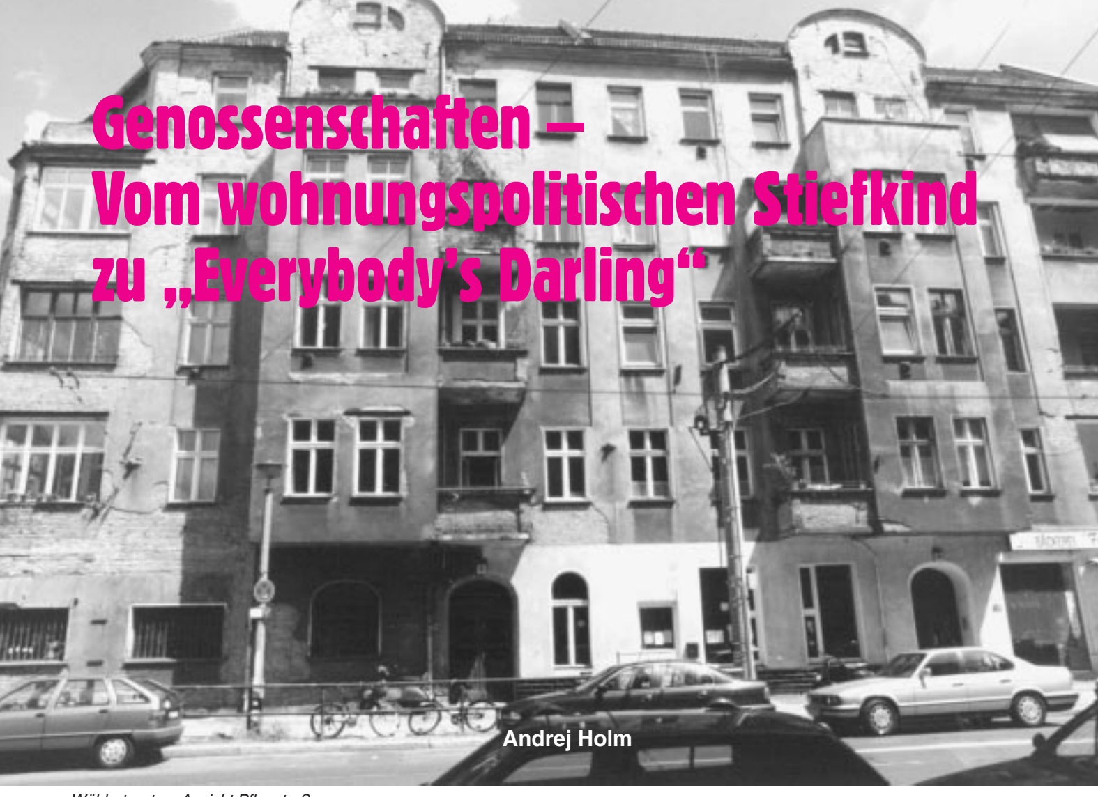
Wöhlertgarten, Ansicht Pflugstraße

Genossenschaften im Wohnbereich spielten bis vor kurzem eine untergeordnete Rolle im bundesdeutschen Wohnungswesen. Mit Ausnahme einiger, aus der DDR hinüber geretteter, Großgenossenschaften in den Neubausiedlungen des Ostens war diese gemeinschaftliche Eigentumsform eine marginale Erscheinung. Nur ganze 4% des Wohnungsbestandes im Westen gegenüber 18% im Osten waren 1992 in genossenschaftlichem Eigentum. Durch die Privatisierungen im Zuge des sogenannten Altschuldenhilfegesetzes hat sich dieser Anteil seither auf knapp 14% verringert. Vor allem Benachteiligungen in der Steuergesetzgebung, die geringen Subventionsmöglichkeiten und die komplizierten Anforderungen des Gesellschaftsrechts an Neugründungen von Genossenschaften macht sie gegenüber anderen Eigentumsformen unattraktiv. Als im ostdeutschen Altbaubereich nach 1990 der umfangreichste Vermögenstransfer und Eigentümerwechsel in der bundesdeutschen Geschichte stattfand, setzen sich professionelle, an kurz-