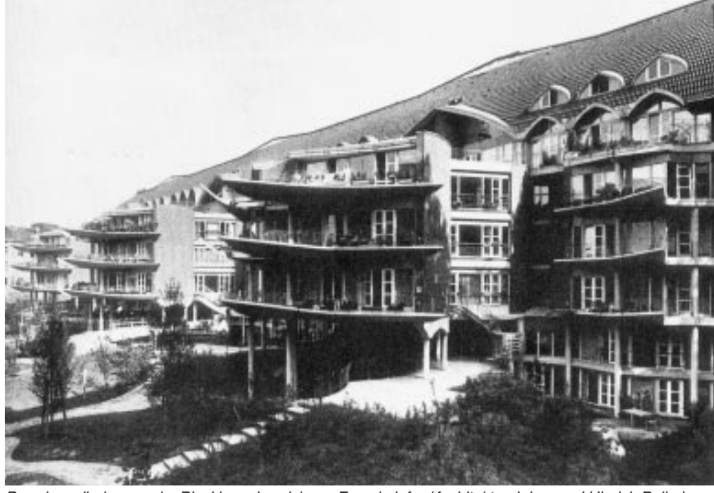
Brandwandbebauung im Blockinnenbereich am Fraenkelufer (Architekten Inken und Hinrich Baller)

Die Hoffnung ist, dass dieses neue Regulationsmodell, der "aktivierende Staat" wie ihn Bundeskanzler Gerhard Schröder nannte, einerseits in zunehmendem Maße mit den Verwertungsinteressen großer Kapital-