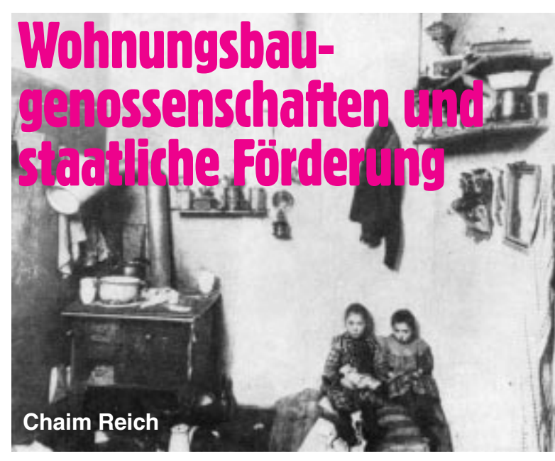
Wohnungselend um 1900, Kochküche in der Danziger Straße

Genossenschaften erreichten in den 20er Jahren einen produktionstechnischen und wirtschaftlichen Höhepunkt. Sie waren eine Reaktion der Gewerkschaften und der Arbeiterbewegung auf die nicht eingelösten Sozialisierungsversprechen Nachkriegsregierung der Weimarer Zeit. Die großen Leistungen der Wohnungsbaugenossenschaften waren nur durch die Zusammenarbeit der Gewerkschaften, Krankenkassen, Kreditinstitute und den entsprechenden Dachorganisationen wie der DEWOG möglich. Ein durchgreifender Erfolg für die Wohnraumversorgung wie in Wien blieb aus, da in Berlin weder eine durchgreifende Umlagefinanzierung erfolgte noch der Kapital- und Bodenmarkt umgangen werden konnte. Auch die Sozialisierungsbeiträge und die Hauszinssteuer reichten zur Finanzierung nicht aus, zumal Zugriffsmöglichkeiten auf einen Althausbestand völlig fehlten. War der Wiener Gemeindewohnungsbau rein kommunal gesteuert, so blieb es in Berlin bei einem wirtschaftlichen, wenn auch gemeinwirtschaftlichem und reformpolitischem Weg. Die Kette der Umverteilung wurde hier nicht geschlossen, und es führte äußerer Druck zu Ökonomisierung und Zentralisierung, innerer Druck zu Filz. Der Entwurf einer Solidargemeinschaft von Wohnungsinhaber und Wohnungssuchendem wurde nicht erfüllt.