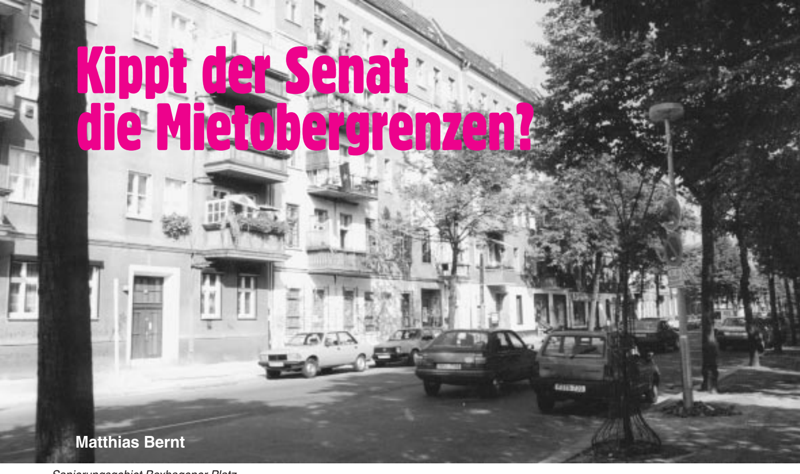
Sanierungsgebiet Boxhagener Platz

Mieter in den Ostberliner Sanierungsgebieten müssen künftig mit erheblichen Mieterhöhungen rechnen. Denn wie erst jetzt bekannt wurde, hat Senator Strieder (SPD) am 24.Oktober erstmals einem Widerspruch von Eigentümern stattgegeben, die gegen die ihnen vom Bezirk Prenzlauer Berg auferlegte Mietobergrenze klagten. Diese gilt bislang für fünf Jahre und soll die Mieten nach Modernisierung auf ein sozialverträgliches Niveau drücken, um eine Verdrängung ärmerer Bevölkerungsschichten zu verhindern.