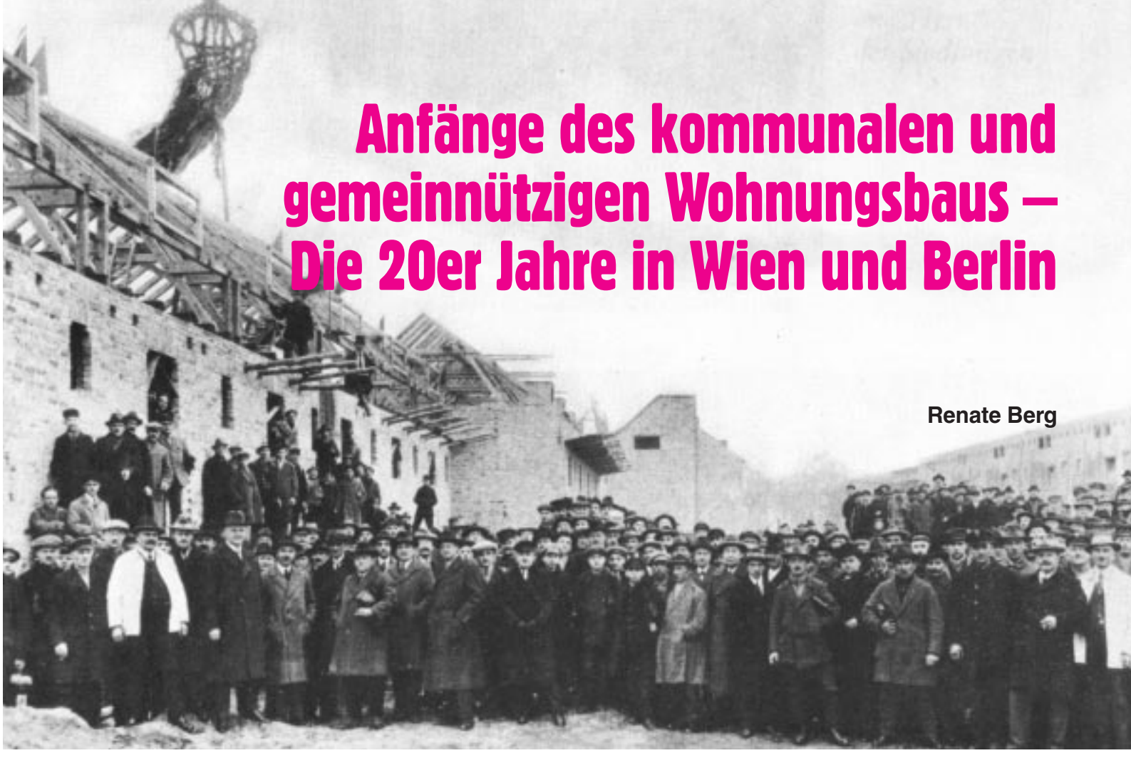
Richtfest Hufeisensiedlung, der ersten Großsiedlung der GEHAG

Die Geschichte des sozialen Wohnungsbaus wird ganz offensichtlich beendet. Der bereits erfolgte (GEHAG) oder beschlossene (GSW) Verkauf der kommunalen Wohnungsbaugesellschaften oder die teilweise Veräußerung der Bestände sind ein Teil dieses Prozesses. Die Wohnungsversorgung wird wieder stärker privatwirtschaftlich gelöst und die Eigentumsbildung gefördert: Steuerungselemente der Wohnraumversorgung sowie die Idee der Gemeinnützigkeit hingegen werden abgebaut. Seit den 20er Jahren wurde mittels kommunalem und oder gemeinnützigem Wohnungsbau versucht, Probleme der Wohnraumversorgung zu lösen. In beiden Städten aus der Arbeiterbewegung heraus, waren es in Wien der Gemeindewohnungsbau und in Berlin die gemeinnützigen Gesellschaften und Genossenschaften der sozia-Ien Bauwirtschaft, welche sozial(isiert)en Massenwohnungsbau ermöglichten. Die quantitativen und qualitativen Verbesserungen der Wohnraumversorgung wurden jedoch auch schon damals nur durch kommunale Steuerungen erzielt. Die Genossenschaftsidee war