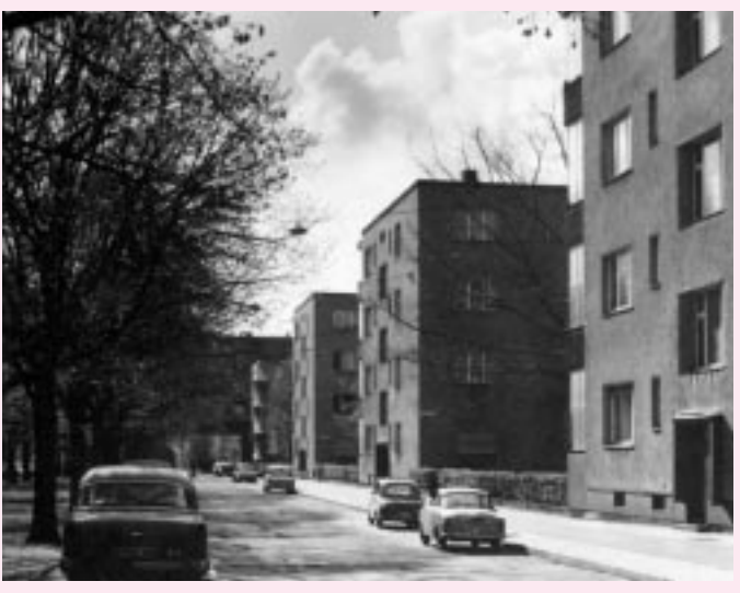
Friedrich-Ebert-Siedlung in Berlin-Reinickendorf, erbaut um 1930

Bündnis 90/Die Grünen stehen CDU und SPD in Berlin auf, ihweiterhin zu einer kommunal rer sozialen Verantwortung für verantwortungsbewussten, so- die Berliner Bevölkerung endlich