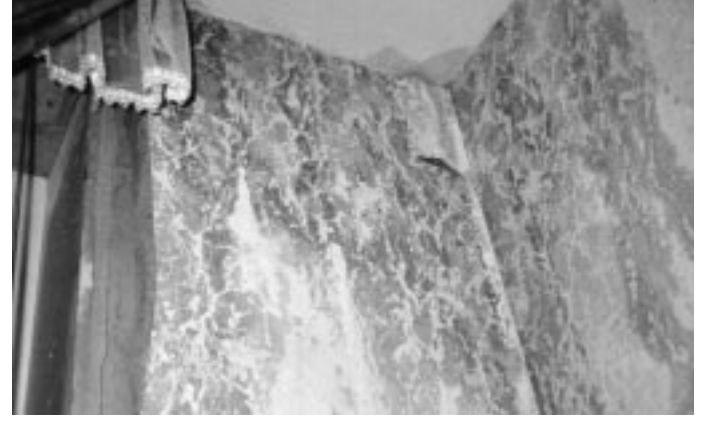
Undichte Stellen im Dach aufgrund eines unsachgemäß installierten Balkons lassen das Wasser die Wände hinablaufen.