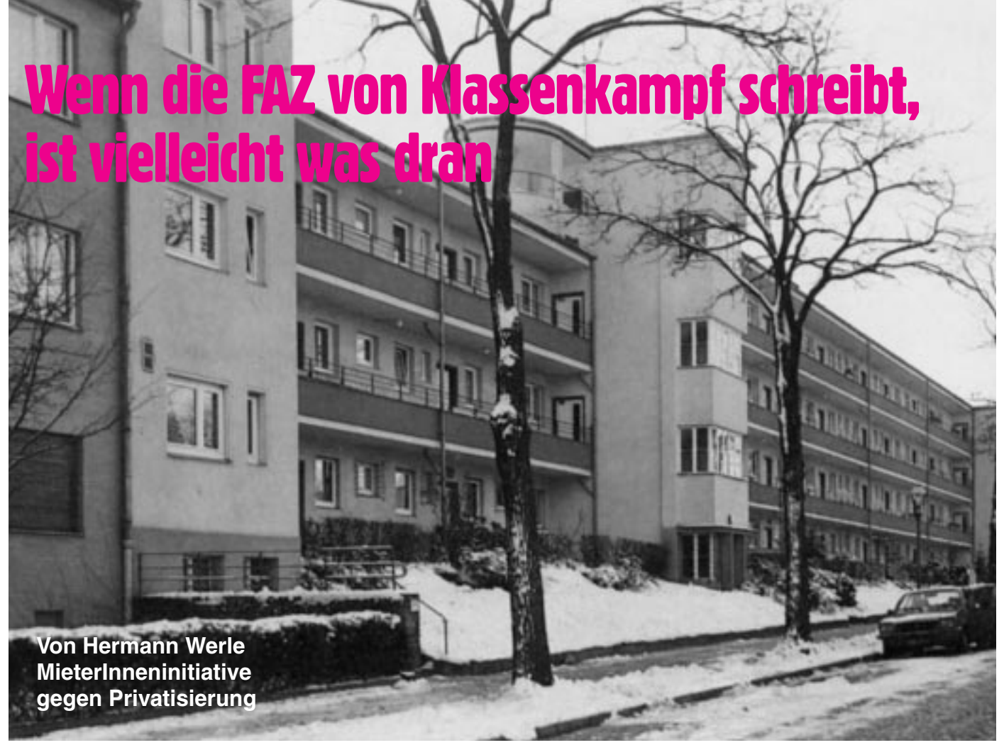
Spree-Siedlung in Berlin-Schöneweide, erbaut um 1932

Seit Januar diesen Jahres trifft sich jeden Freitag um 16:30 Uhr die MieterInneninitiative gegen Privatisierung, um Widerstand gegen den geplanten Verkauf der GSW zu organisieren, aber auch um auf die viel weitergehenden Maßnahmen des Sozialabbaus auf kommunaler und bundesweiter Ebene hinzuweisen.