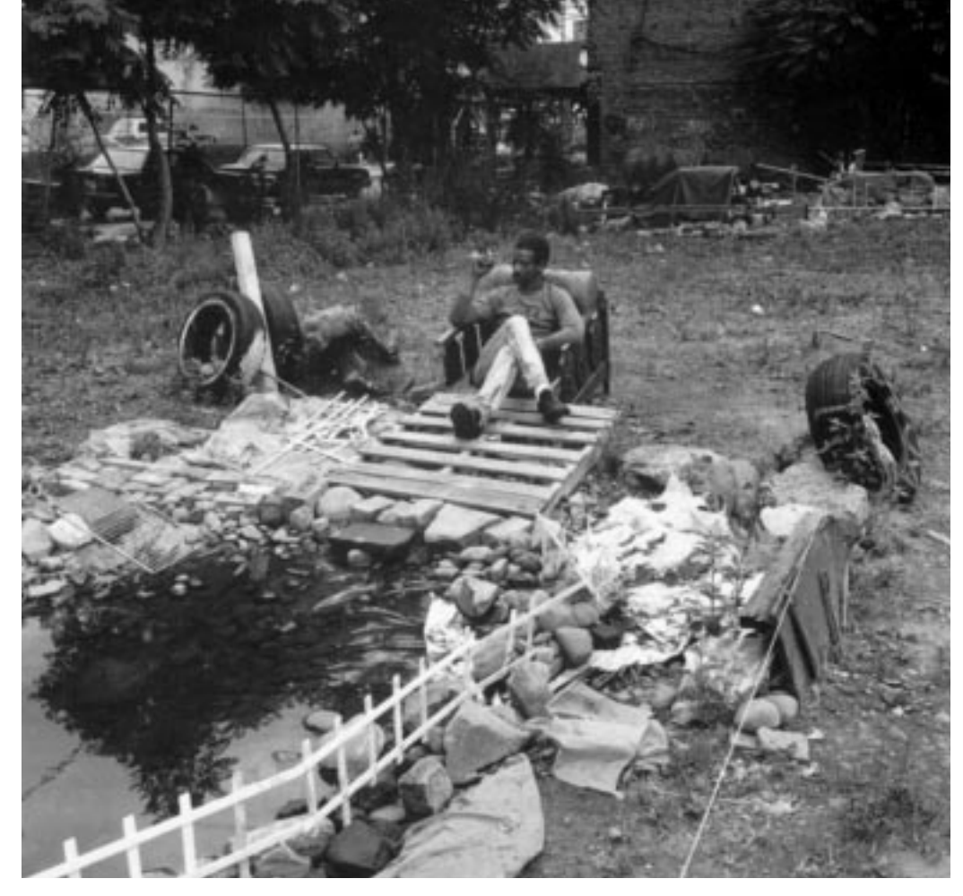
Jimmys Garten ist eine Kollektion von Steinen, Abfalltüten, Reifen und Sesseln (aus "Vergängliche Gärten", Foto: Margaret Morton)