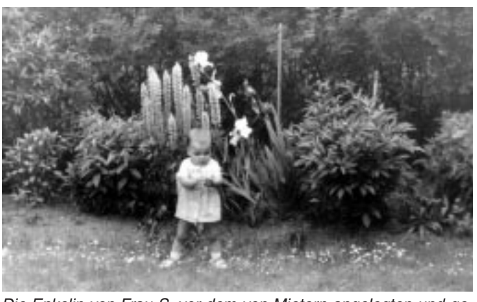
Die Enkelin von Frau S. vor dem von Mietern angelegten und gepflegten Garten Foto 1980, privat

Ab Februar behielt sie die ganze Miete aufgrund der gravierenden Mängel ein, doch auch das änderte nichts. Sie wurde immer kränker. Sicherlich, sie hätte sich ein Pensionszimmer nehmen können und die Kosten der Konzept in Rechnung stellen, sicherlich hätte sie von der Konzept noch eine ordentliche Abfindung herausschlagen können, dass sie die Wohnung frei-