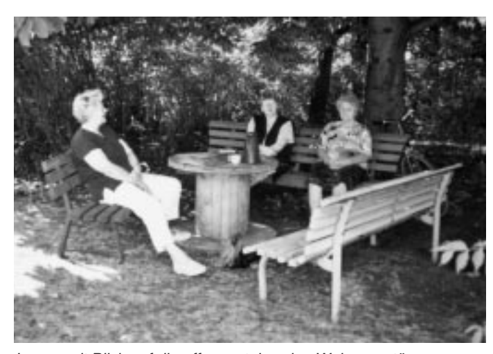
Immer mit Blick auf die offenenstehenden Wohnungstüren Foto 1999, privat

Ende letzten Jahres zeigten sich dann an ihrer Wohnungsdecke die ersten Wasserflecken – der Dachgeschossausbau zeigte sichtbare Folgen. Sie meldete