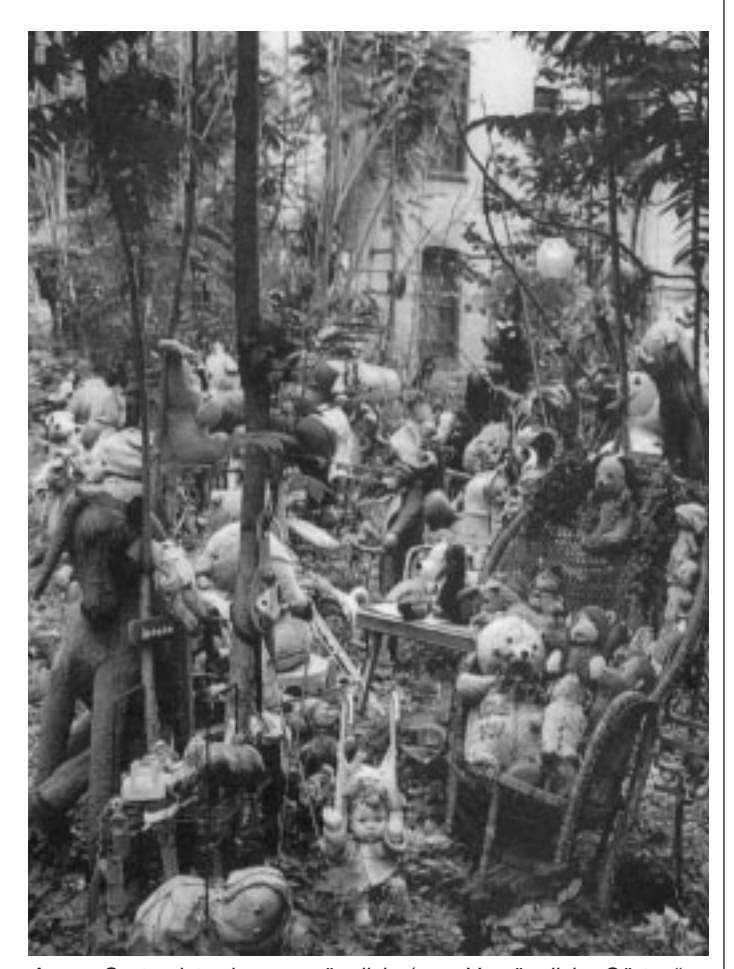
Annas Garten ist schwer zugänglich, (aus "Vergängliche Gärten", Foto: Margaret Morton)

des Laisser-faire-Kapitalismus und die Ausbreitung des Marktwertes in allen Bereiche des Lebens unsere freiheitliche und demokratische Gesellschaft gefährdet. Der größte Feind der freiheitlichen Gesellschaft ist nicht länger die kommunistische, sondern die kapitalistische Bedrohung.(...) Zu viel Wettbewerb und zu wenig Zusammenarbeit kann unerträgliche Ungleichheiten und Instabilität hervorrufen.(...) Die Doktrin des Laisser-faire-Kapitalismus basiert auf der Annahme, dass dem Gemeinwohl am besten gedient ist, wenn jeder seine eigenen Interessen ungehindert verfolgen kann. Solange es jedoch nicht durch ein gemeinsames Interesse gemäßigt ist, das über den Interessen des Einzelnen steht (...) läuft unser gegenwärtiges System Gefahr zusammenzubrechen."