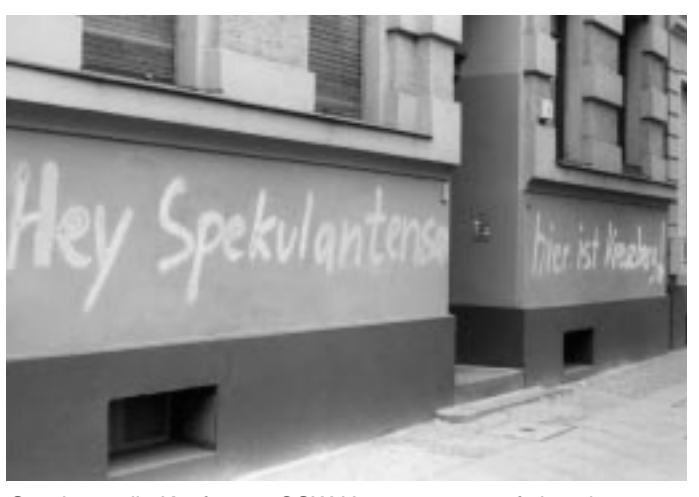
So wissen die Käufer von GSW-Häusern, was auf sie zukommt

In diesem Zusammenhang wird der finanzpolitische Unsinn dieser Privatisierungen deutlich: Langfristig werden steigende Sozialausgaben, beispielsweise für erhöhtes Wohngeld, ein größeres Loch in den Finanzhaushalt der Stadt reißen, als man jetzt mit dem Verkauf der GSW zu stopfen wünscht. Der städtische Wohnungsbau konnte bisher – bei all seinen Män-