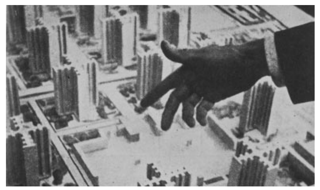
"So sieht die Stadt der Zukunft aus!" – Le Corbusiers Finger weist 1928 die Richtung für ein technokratisches Modell. Die "strahlende Stadt" soll das reale Paris ersetzen.

ralismus der sechziger Jahre brachte enorm erweiterte Erkenntnisse über die Zukunft des Städtischen, nachdem Fourastié den Prozess der Tertiärisierung entdeckt hatte. Man ging damals bei noch ungebremsten Wachstumserwartungen von einer raschen Konvergenz der Systeme und einer die nationalen Ökonomien auflösenden universalen Weltgesellschaft aus. Es bedurfte erst des "Zukunftsschocks" an der Wende zu den siebziger Jahren, dem in Gang befindlichen Umbruchsprozess zu veränderten Formen des