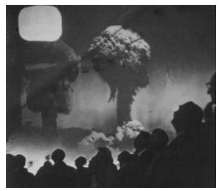
EXPO 1998 - Leute vor der Atombombenprojektion im Philipps-Pavillon