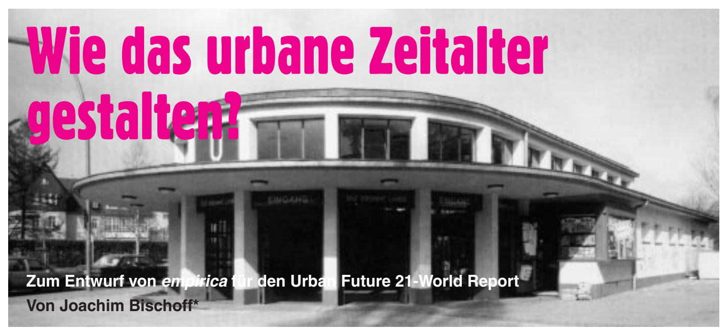
Station Krumme Lanke – 1929

Im Übergang zum 21. Jahrhundert lebt mehr als die Hälfte der Menschheit in einer Stadt. Allerdings sind die Lebens- und Umweltbedingungen keineswegs zufriedenstellend. Der Trend der bisherigen Stadtentwicklung besteht in der Aufspaltung - oder wechselseitigen Entfremdung - des Zusammenhanges von Bevölkerung, Wohnen, Ökonomie und Arbeit, sowie sozial-kulturellen Dienstleistungen. Insoweit besteht ein internationaler Verständigungsbedarf darüber, wie sich die bisherige Entwicklung mit ihren unbefriedigenden Zuständen umkehren lässt, denn es besteht Handlungsbedarf.