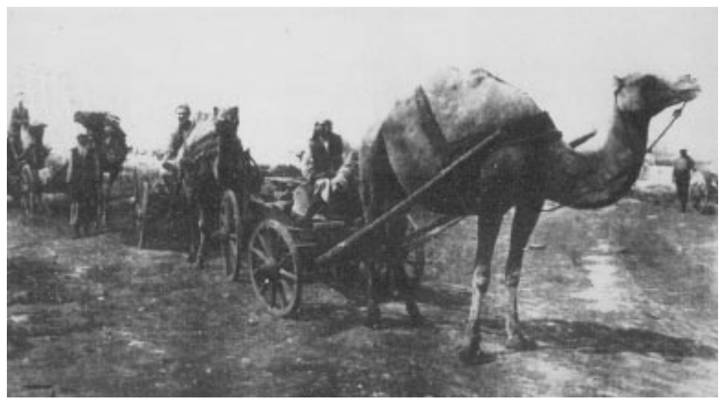
Stalinistische Urbanisierung in Sibirien, Aufbau der Stadt Orsk 1932

gut in das Bild einer hochgradig gelungenen Inkorporation. Greenpeace und Gesellschaften für bedrohte Völker verstören mit ihren Aktionen nicht mehr - sie gehören als hoffnungsvolle Selbstheilungspotentiale ins System. Wie auch die Expo in Hannover zeigt, werden ökologische Komponenten heute gewissermaßen wie ein Placebo verwendet. Ein Beispiel mag das verdeutlichen: In einer chinesischen Millionenstadt werden inzwischen täglich 300 neue Privatautos zugelassen. Besorgnis aber erregt das bei keinem der dortigen Planer, denn sie versichern mit strahlenden Augen, es würden weitgehend deutsche Autos mit guten Katalysatoren importiert. Da wird die Welt gewiss genesen! Auch die Berichterstatter der urban-21-Konferenz Berliner scheinen aus einem Lande des Lächelns zu kommen, denn das große Projekt, das sie der Menschheit vorschlagen, wird zuversichtlich "die Wiedererfindung der Stadt" genannt.