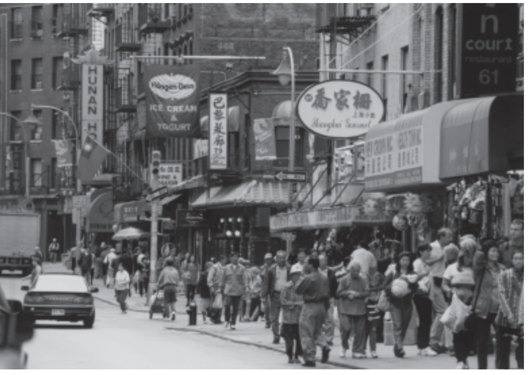
Chinatown - Mulbellystreet - New York

Entschiedene kommunalpolitische Handlung. Ja, natürlich. Aber welche Art von Politik? Die Autoren erklären: "in Kooperation mit der Zivilgesellschaft". Bedeutet das, eine Zivilgesellschaft autonom vom (lokalen) Staat? Eine organisierte Zivilgesellschaft? Und handelt es sich dabei um eine Zivilgesellschaft mit einem freundlichen Gesicht (eine Damengartengesellschaft) oder eher um eine