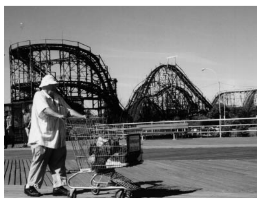
Cony Island – New York

1. Die Aussage, gesellschaftliche Ausgrenzung nicht als unvermeidliche Begleiterscheinung hinzunehmen (wie das in der neoliberalen Phase der Deregulierung und Privatisierung geschah),