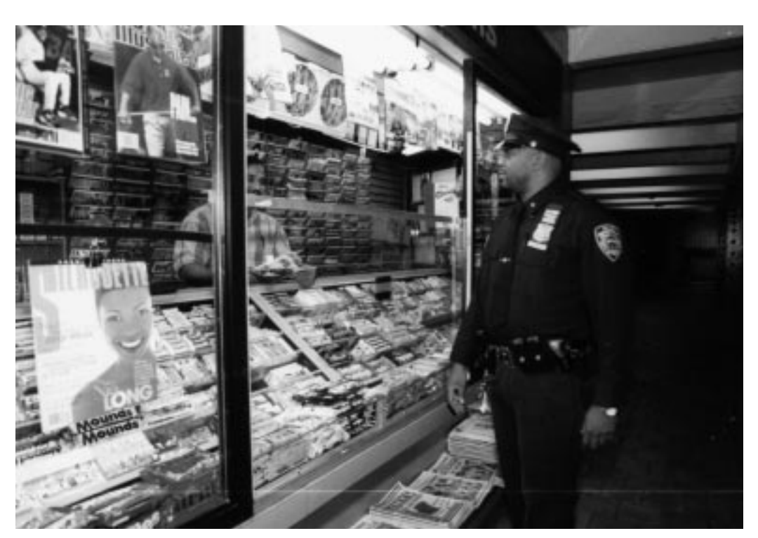
Haarlem U-Bahnstation – New York

che Konzeption jedoch nicht mehrheitsfähig bleiben. Eine sozialistische Linke, die eine Gegenkonzeption wirksame entwickeln will, muss die Fragen einer Steuerung der Ökonomie, einer gründlichen Reform der Verteilungsverhältnisse und der Entwicklung einer Zivilgesellschaft aufgreifen und in den Mittelpunkt ihrer Anstrengungen stellen. Die Charakterisierung der "modernisierten Sozialdemokratie" als weichgespülte Neoliberale trägt allerdings nicht zur Erhellung der Aufgabenstellung bei, sondern verkleistert eher die Herausforderungen für die Linke.