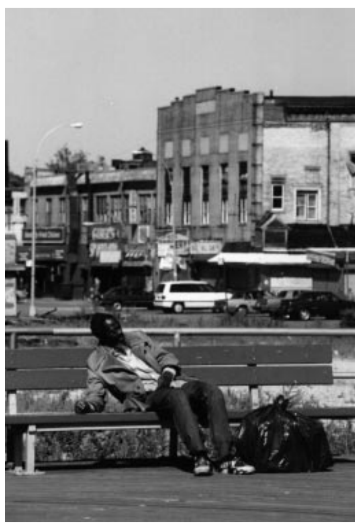
Cony Island - New York

müssten dieselben Grundrechte im größtmöglichen Maße garantiert werden. Bestmögliche Startchancen - möglichst für alle – heißt hier in erster Linie Gleichheit der Chancen, nicht Gleichheit der Ergebnisse, die die Subjekte erzielen, wenn sie ihre Chancen nutzen. Praktisch bedeutet Chancengerechtigkeit oder optimale Ungleichheit: "Das wichtigste Feld der Gleichheitspolitik bleibt jedoch die Hilfe für Leistungsschwächere, die auf Märkten heute kein Mindesteinkommen erreichen können. Die Arbeitsmärkte für einfache Tätigkeiten und Produkte müssen ausgeweitet werden. Es ist wichtiger und wirksamer. die Zahl der Sozialhilfeempfänger zu verringern als die Zahl der Millionäre, vor allem wenn die Millionäre durch Investitionen Arbeitsplätze schaffen."9 Optimale Ungleichheit heißt weiter: nicht nur in den hoch-