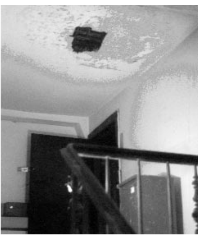
Wasserschaden seit 1991 wird nicht behoben

Ansprechpartner für das Haus gab es nicht. Auftretende Schäden mussten individuell aufge-