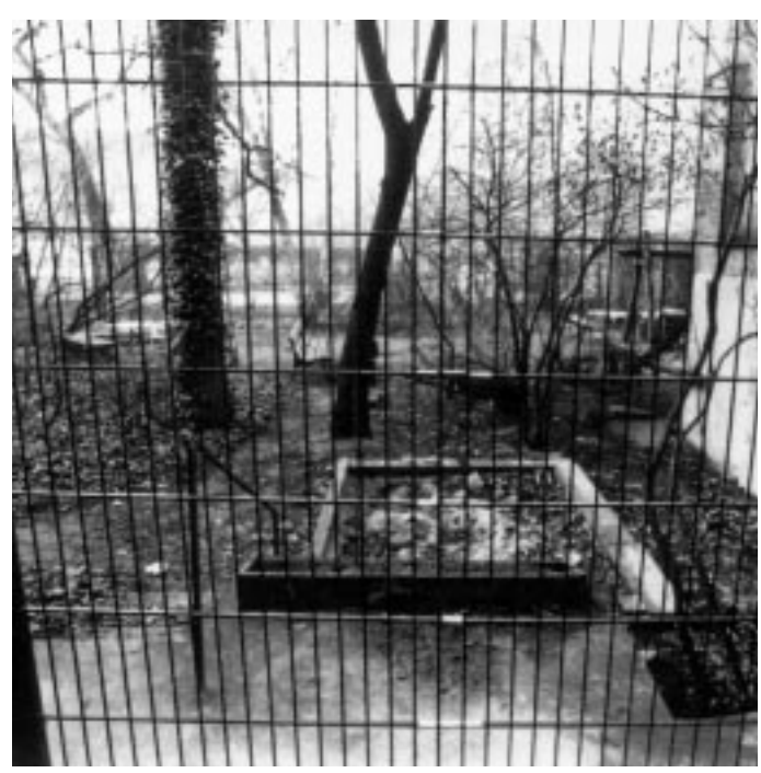
▲ Nachher: Der einst offene Hof erinnert an ein Gefängnis

gen – datiert aus den Anfängen der 80er Jahre - war dem Voreigentümer (GRUNDAG) bekannt und wurde bei den häufi-Begehungen anlässlich