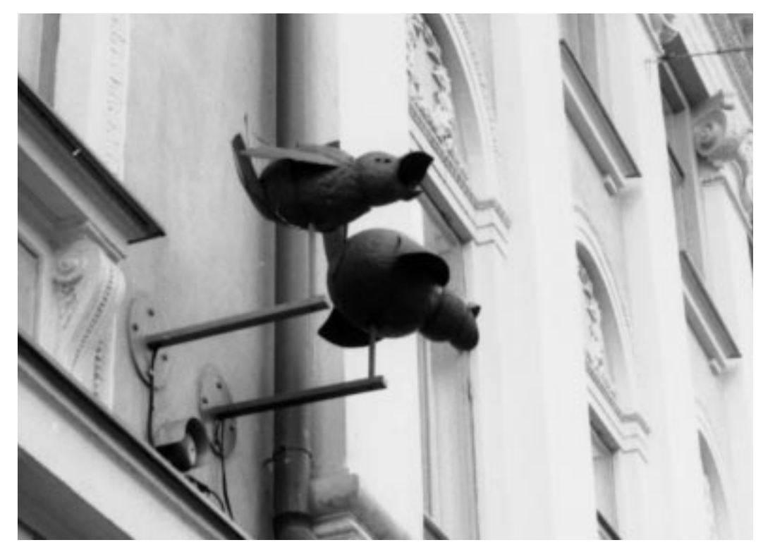
In den "Eisenvögeln" versteckte Videokameras hinter dem Präsidentenpalast in Helsinki, Finnland (1999)

zu verkaufen, aber wenn Du Videoüberwachung machen willst, brauchst Du das nicht.