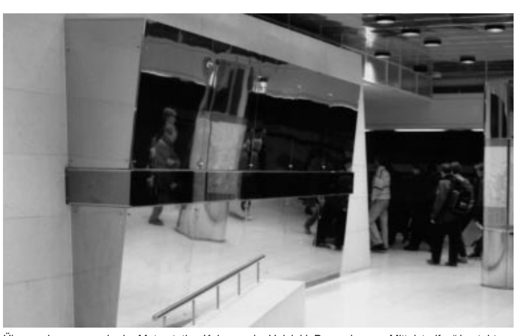
Überwachungsraum in der Metrostation Kaisameniu, Helsinki. Der "schwarze Mittelstreifen" besteht aus getöntem Glas, das einseitig transparent ist. Das dahinter platzierte Wachpersonal sieht die Passanten, die aber nicht die Überwacher.

Überwachung wird bei uns in öffentlichen Räumen de facto überhaupt nicht reguliert. Zwar