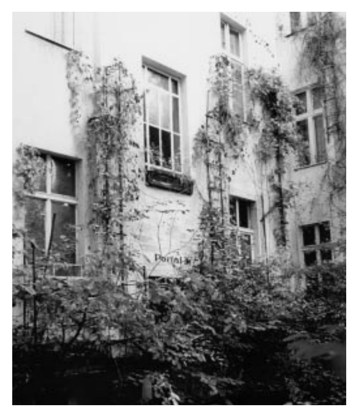
▲ Vorher: Der idyllische, preisgekrönte Hof.

doch bis dato nicht vor. Auch vor Gericht zum Termin wegen der Einstweiligen Verfügung hat die Gegenseite keine Berechnungen vorgelegt, sondern nur die Behauptung wiederholt: Es gäbe sie.