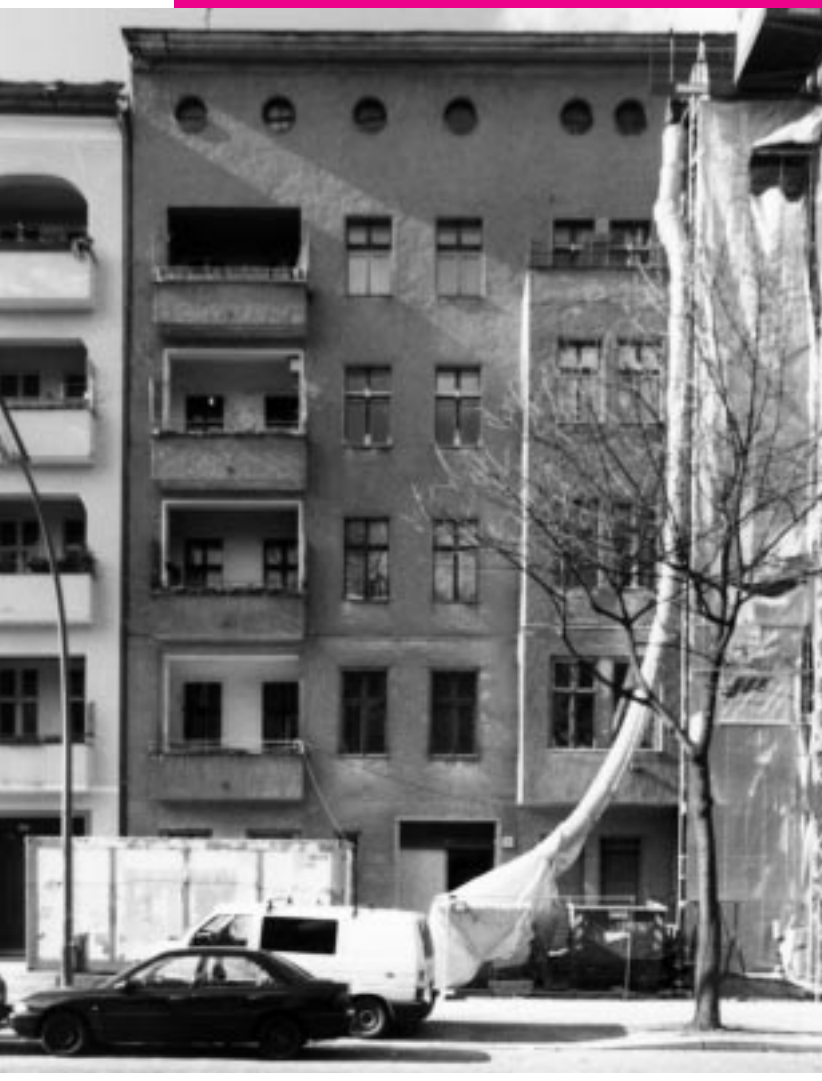
Vorher: MieterInnen werden vertrieben

Der Leerstand, wen wundert's, drang inzwischen munter in weitere Wohnungen ein.