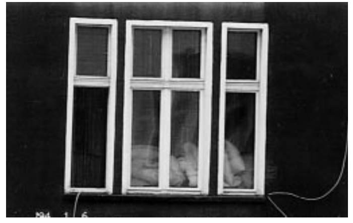
...Zu einer illegalen Pensionsnutzung des Vorderhauses gehört natürlich auch eine ebenso illegale Wäschekammer (November 1998)

"Der letzte Punkt ist für uns der entscheidende. Das illegal zweckentfremdete Vorderhaus Emanuelstraße 3 befindet sich in