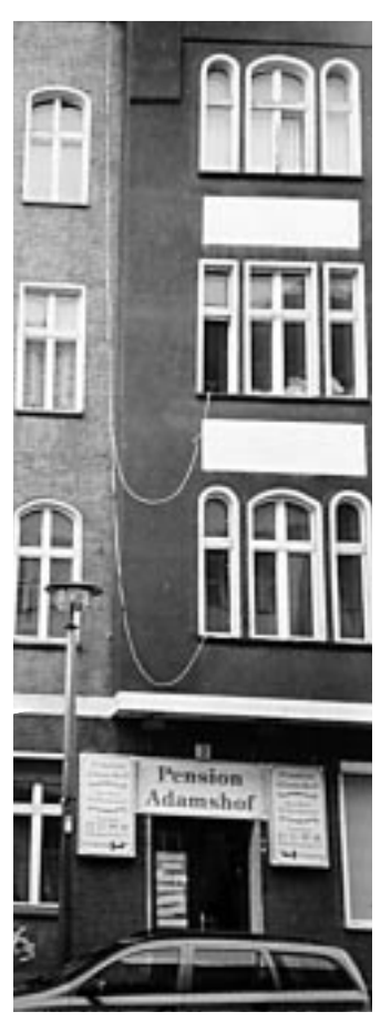
Emanuelstr. 3: Das Schild "Pension Adamshof" bezieht sich offiziell nur auf das Quergebäude, über den Hof zu erreichen. Man achte auf das Erker-Fenster im zweiten Stock....

"Die Zweckentfremdung von Wohnraum widerspricht grundsätzlich den Zielen der Stadterneuerung, soweit sie nicht im Einzelfall zur Gebietsentwicklung unabweisbar ist." (aus "Leitsätze zur Stadterneuerung in Berlin", beschlossen vom Senat von Berlin am 31.August 1993)