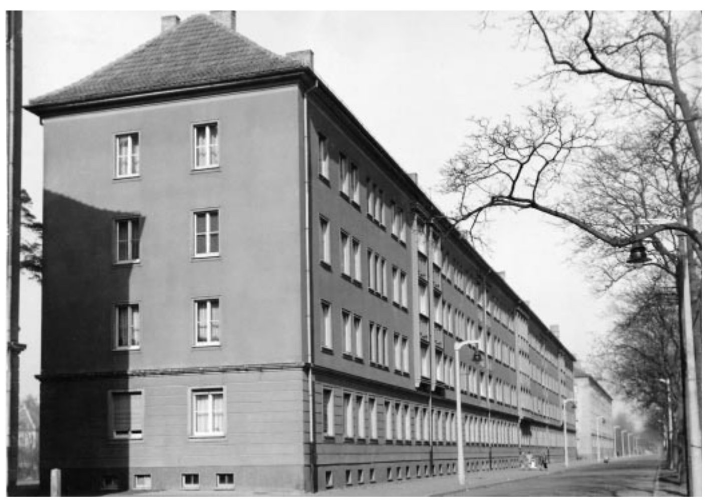
Als die ersten Mieter eingezogen waren